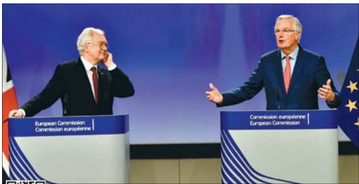
وزير الدولة البريطاني لشؤون «بريكست» ديفيد ديفيس (يسار) ورئيس الوفد الأوروبي ميشيل بارنيير في بروكسل أمس (رويترز)

التعديل لتفادي أي التباس، لكن بعض النواب أعربوا عن القلق من أن موعد تطبيق «بريكست» ليس مدرجا في مشروع القانون الذي قدمته حكومة ماي. وجاء ذلك متزامنا مع جولة المفاوضات السادسة في بروكسل بين الجانبين. هذا، ويذكر أن مسودة مشروع قانون الانسحاب من الاتحاد الأوروبي نوقشت مرتين على مستوى مجلس العموم واللجان المختصة وستتم مناقشتها للمرة الثالثة وفق الإجراءات المعمول بها قبل التصويت عليها لتصبح تشريعا ملزما للحكومة. جاء ذلك في وقت كرر الدبلوماسي البريطاني جون كير، الذي صاغ المادة 50 من معاهدة لشبونة التي تنص على إمكانية الخروج من الاتحاد الأوروبي والتي فعلتها لندن للمرة الأولى في تاريخ الاتحاد، أن عملية الخروج تنطوي على آلية عكسية إذا غيرت الدولة العضو التي فعلتها رأياها. وصرح كير خلال احتفال نظمته حركة «اوبن بريتان» (بريطانيا المفتوحة) المؤيدة