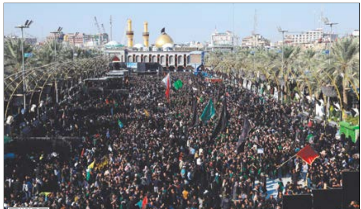
ملايين الشيعة خلال احيائهم أربعينية الامام الحسين في كربلاء امس