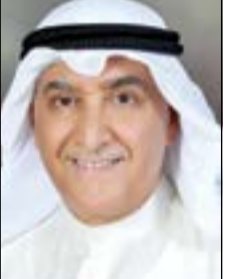
إلى مني «بالكويتية»؟!

لقد تقاءلنا خيرا عندما بدأت الخطوط الجوية الكويتية في تغيير أسطول الطائرات القديمة بأسطول جديد من إيرباص وبوينغ، وذلك بعد قرار الحكومة عام 2012، وبالفعل بدأت بتسلم الطائرات الجديدة على مراحل في 2014. وأصبح لدينا طائرات جديدة وخطوط رحلات إلى بلدان جديدة، وكذلك خطط استراتيجية لرحلات ومحطات إعادة وتطوير الخدمة داخل الطائرة والالتزام بساعات المغادرة والوصول بحيث تكون دقيقة، وبهذا ستنافس شركات الطيران المحلية والإقليمية والعالمية، وفعلا هناك ردة فعل من ركاب «الكويتية» بأنهم شعروا وعاشوا هذا التغيير ومرتاحون. ولكن للأسف لم تستمر هذه الفرحة والتفاؤل بسبب الإهمال أو الخطأ من إدارة «الكويتية»، ومنها خلل فني لبعض الطائرات، وخدمة الضيافة داخل الطائرة، والالتزام بساعات المغادرة والوصول، ووقوف بعض الطائرات بعيدا عن مبنى المطار والركوب والنزول من سلم الطائرة وخاصة لكبار السن، وغيرها. ولكن لم أستوعب ما يقال أو ينشر في وسائل التواصل الاجتماعي عن الخطوط الكويتية حتى حدثتني لم أتوقعه، وهو أنني شخصيا ومعني أهلي قررنا الذهاب الى العمرة وقلنا نختار «الكويتية» نشوف الطائرات الجديدة والتغيير الذي حصل. فجدول إقلاع الطائرة المفروض الساعة 15:25 العصر وحضرنا للمطار الساعة 1 بعد الظهر وخلصنا، وبعدها فوجئنا أو بالأحرى «انصمنا»، أولا بتغيير نوع الطائرة، كما غيروا أماكن حجز الكراسي، وكذلك التأخير في الإقلاع، هذا الأمر سبب لنا