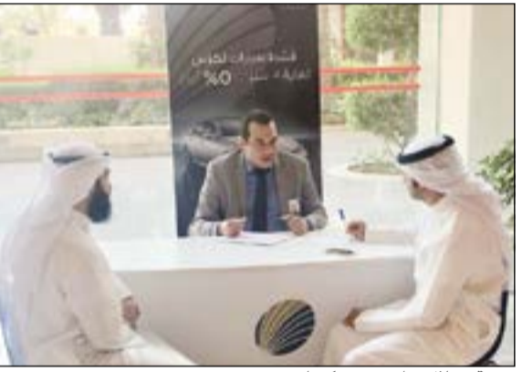
«وربة» خلال تواجدها في «كونا»

تواجد بنك وربة مؤخرا في فعالية اليوم المفتوح في مبنى الرئيسي لوكالة الأنباء الكويتية (كونا) للتعريف بمنتجاته وخدماته الرائدة وتحقيق تواصل أفضل ومباشر مع مختلف شرائح المجتمع في كل القطاعات. وعلى مدار 5 أيام، قدم فريق بنك وربة الشرح الوافي لموظفي «كونا» حول منتجات بنك وربة وآثر عروضه النوعية وأيضاً حوله التمويلية التي يتميز بها وتتسم بالبرونة لتلائم كل الاحتياجات، كما يقدم موظفو بنك وربة أيضا معلومات حول تفاصيل الخدمات والحملات التسويقية التي أطلقها البنك والتي تعود على العملاء منها بالنفع الكثير والمميزات اللامحدودة وتشكل عامل جذب كبير للعملاء. تأتي مشاركة بنك وربة في هذه الفعاليات تأكيداً على التزامه الدائم تجاه عملائه وجميع شرائح المجتمع بالتواجد في مختلف المؤسسات والهيئات في الكويت.