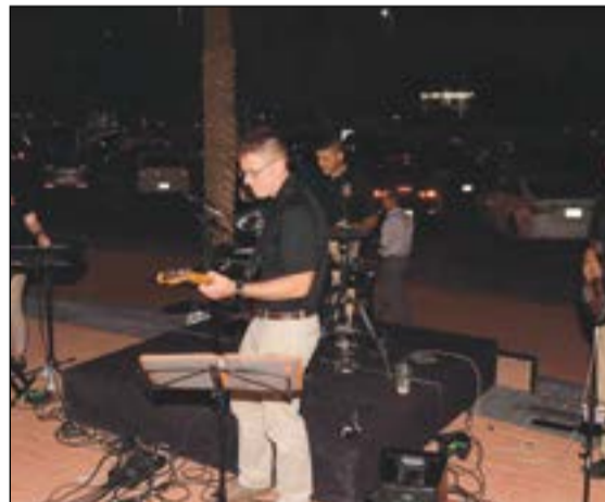
جانب من عرض الفرقة الأميركية