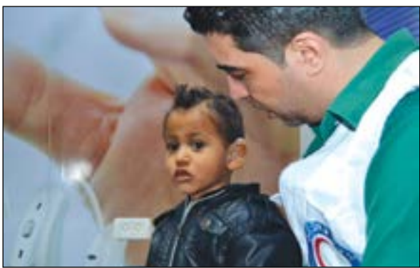
سماة خاصة لطفل فلسطيني قدمتها حملة الهلال الأحمر

البحرين إضافة إلى عشر حالات أخرى بالضفة الغربية والقدس وتوعدت بين زراعة قنريات للعين وتقديم سماعات خاصة لبعض الأطفال الذين يفقدون حاسة السمع إلى جانب معالجة حالات أخرى من بينها زراعة غرسة قوقعة الأذن وزراعة كلي وعلاج تكسر العظام والحروق. وأكدت انه رغم المبادرات والمشاريع والمساعدات التي تصل إلى