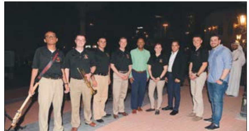
الفرقة الأميركية والمسؤولون في الملحقة الثقافية الأميركية (محمد هاشم)

موسيقية أميركية في الكويت السفارة تنسق لعمل الحفلات الموسيقية، مضيفاً في الوقت نفسه أن بإمكان الجمهور الكريم الحريص على متابعة الأنشطة الثقافية في الملحقة الأميركية متابعة موقع انستغرام usembassyq8