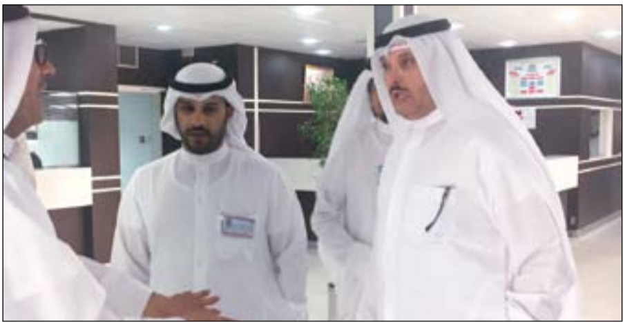
جانب من جولة الوزير في المستشفى

التي تواجه الطاقم الطبي والفني والإداري. كما زار وزير الصحة المرضى في الطوارئ والأجنحة والتأكد من التشخيص السليم وصرّف العلاج المناسب لكل حالة، والتأكد من توافر جميع المستلزمات الطبية والأجهزة الحديثة في المستشفى. وتأتي هذه الزيارة ضمن سلسلة زيارات وجولات يقوم بها وزير الصحة، لتفقد المستشفيات والمراكز الصحية في الكويت والتأكد من توفير خدمة صحية ملائمة للمواطن.