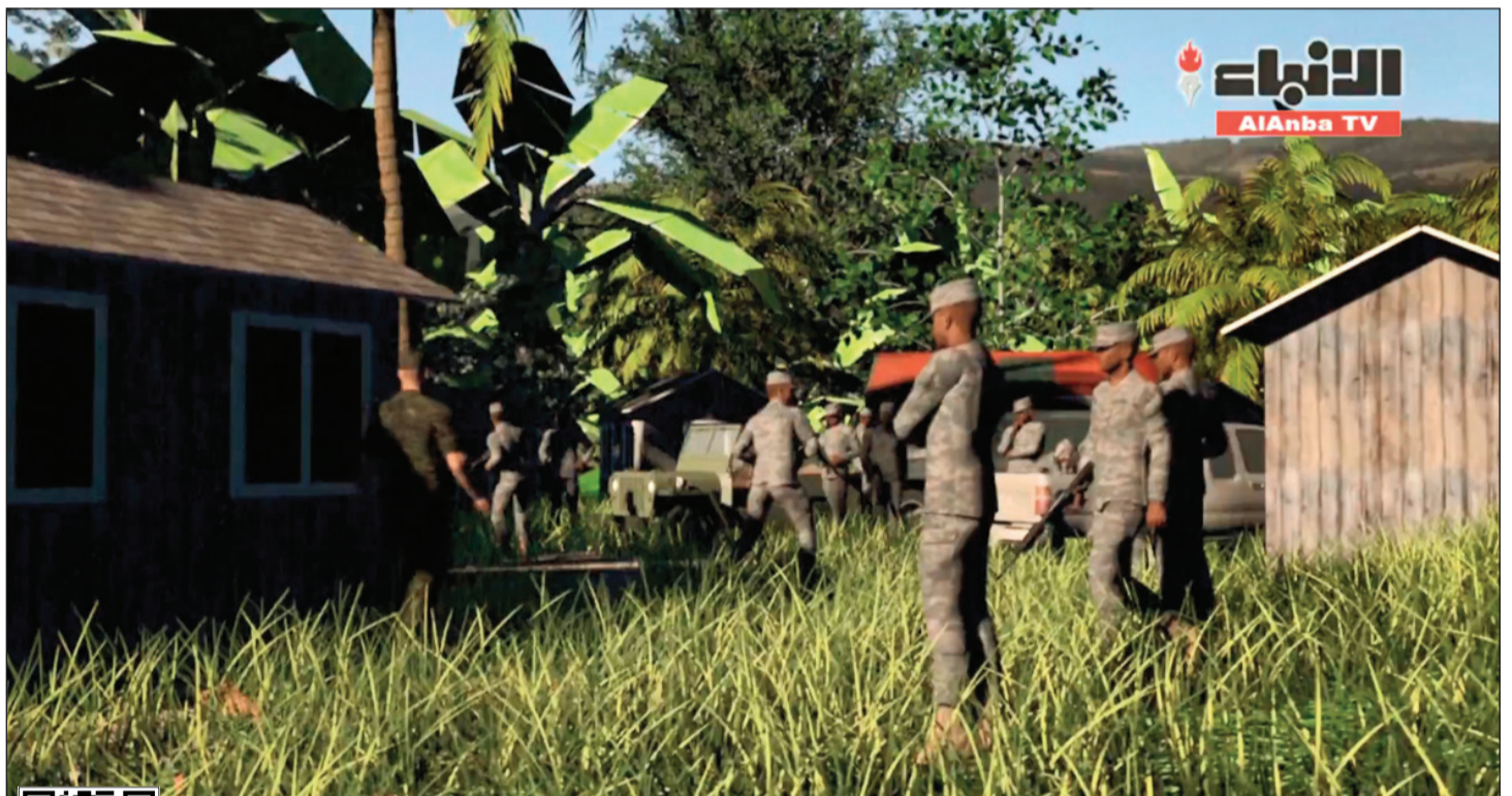
عائدات القوات المسلحة الكولومبية مرتبطة بانتاج الكوكايين