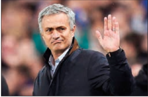
مورينيو وتوديع اليونان

كشفت تقارير صحافية عن قناعة إدارة مان يونايك برغبة البرتغالي جوزيه مورينيو المدير الفني للشبابين الحمر في الرحيل عن مسرح الأحمال بنهاية الموسم الحالي. وذكرت صحيفة «ذا صن» عن مصادر داخل النادي أن عائلة غلينز المالكة لليونان تريد أن «المو» سيرحل بنهاية الموسم الجاري ليتولى تدريب باريس سان جيرمان. وأوضح الصحفي أن السبب وراء ذلك الاعتقاد، هو عجز الفريق عن منافسة مان سيتي بقيادة الإسباني بيب غوارديولا. فرغم البداية الجيدة للشبابين الحمر في الموسم الحالي، إلا أنهم يحتلون المركز الثاني خلف «السيتيزن» بفارق 8 نقاط. كما يقدم الجار مستوى أفضل، مؤكدا أن مورينيو قد يوافق على تولي تدريب سان جيرمان بعد التعاقد مع نيمار وكيليان مبابي، ما يزيد فرصه في الفوز بدوري أبطال أوروبا معهم.