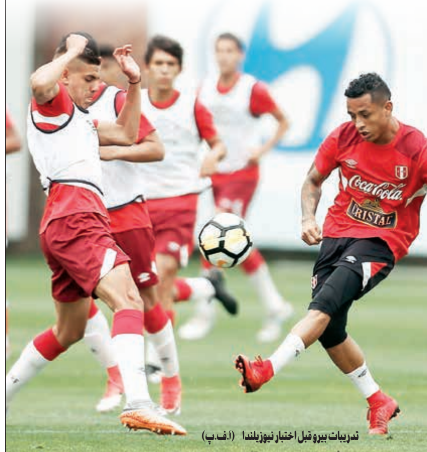
تدريبات بيرو قبل اختبار نيوزيلندا (أفب)

وصعد منتخب هندوراس لكأس العالم في ثلاث مناسبات، من بينها آخر نسختين للبطولة، لكنه عجز خلالها عن عبور مرحلة المجموعات. في المقابل، يطعم المنتخب الأسترالي إلى بلوغ المونديال للمرة الخامسة في تاريخه والرابعة على التوالي، حيث صعد للملحق عقب فوزه على المنتخب السوري في مباراة الملحق الآسيوي التي جرت بين المنتخبين الحاصلين على المركز الثالث في مجموعتهما بالتصفيات الآسيوية.