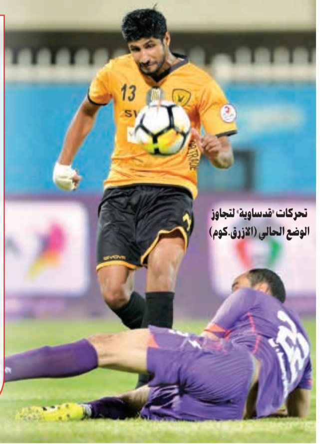
تحركات «حساوية» لتجاوز الوضع الحالي (الأزرق، كوم)

وتسربت بعض الأخبار عقب الاجتماع، والتي تفيد بعزم الحساوي على التكفل بصفقة محترف أجنبي على مستوى عال خلال الانتقالات الشتوية في يناير المقبل، دعماً منه لـ «الأصفر». هذا، وعاود القادسية تدريباته مساء امس بعد الراحة التي منحها الجهازين الإداري والفني للاعبين عقب مباراة العربي (3-1) مساء الثلاثاء الماضي ضمن الجولة الثالثة لحساب المجموعة الثانية من كأس الاتحاد.