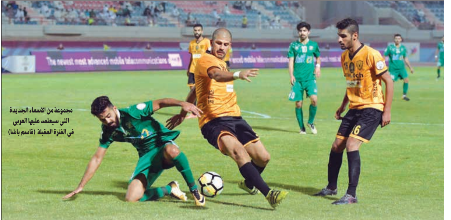
مجموعة من الأسماء الجديدة التي سيستخدم عليها العربي في الفترة المقبلة