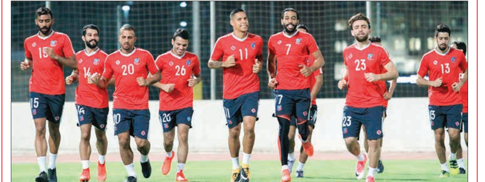
(المركز الاعلامي بنادي الكويت)