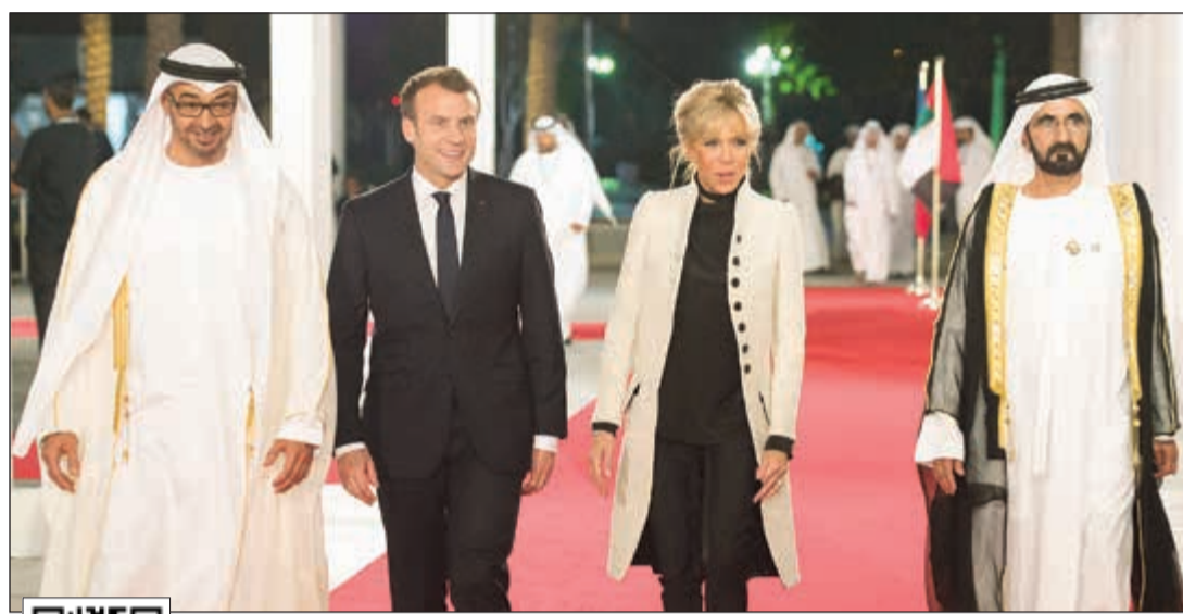
نائب رئيس دولة الإمارات رئيس مجلس الوزراء حاكم دبي صاحب السمو الشيخ محمد بن راشد آل مكتوم وولي عهد أبو ظبي صاحب السمو الشيخ محمد بن زايد آل نهيان والرئيس الفرنسي إيمانويل ماكرون قبيل حضورهم افتتاح متحف «اللوثر أبو ظبي»، أول من أمس