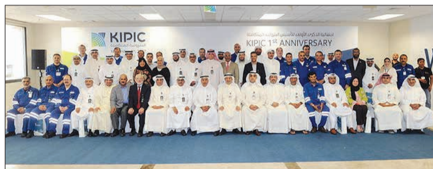
الإدارة العليا في صورة تذكارية مع مجموعة من المديرين وروؤساء الفرق