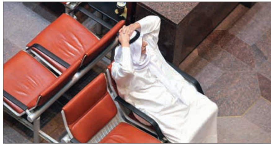
مؤشرات البورصة تواصل التفریط في مكاسبها المحققة في 2017

تعرضت بورصة الكويت لعمليات بيع قوية على مدار أول 3 جلسات من الأسبوع، حقت معها المؤشرات والمتغيرات خسائر طائلة، إلا أن الجلستين الأخيرتين شهدتا تحسناً ملحوظاً على وقع عمليات شرائية لمحاظ أعادت للسوق توازنه المفقود. وفي خضم عمليات البيع الكبيرة التي ركزت على أسهم قيادية في عدد من القطاعات أبرزها القطاع البنكي، خسرت القيمة الرأسمالية للبورصة خلال الأسبوع نحو 1,4 مليار دينار، واستقرت القيمة الرأسمالية للبورصة عند 26,979 مليار دينار انخفاضاً من 28,430 مليار دينار الأسبوع الماضي. وتأثر السوق خلال تعاملات الأسبوع بعدة عوامل أهمها: ● سادت حالة من القلق بين المتعاملين سواء أفراد أو محافظ محلية وأجنبية في ظل التطورات المتسارعة على المستوى الإقليمي، دفعت مستثمرين كباراً للبيع والخروج من أسواق المنطقة. ● عدم استقرار الأوضاع السياسية على المستوى المحلي، وسط ترقب لتشكيل الحكومة الجديدة. ورغم تأثير هذه العوامل السلبيّة على السوق، إلا أن التحسن الملحوظ في أسعار النفط الكويتي الذي تجاوز مستوى 60 دولاراً للبرميل