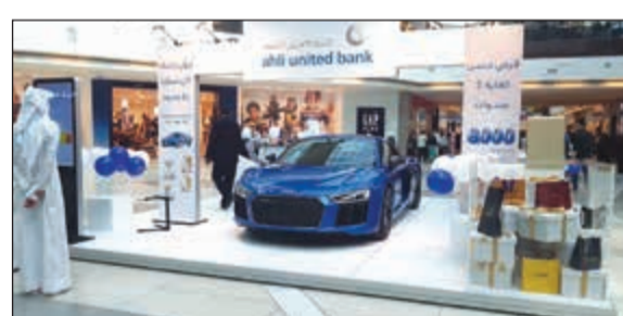
جناح «الأهلي المتحد» في الأقنيوز

شهرياً بحد أقصى 50 ألف دينار وكذلك تأمين تكافئ ضد الوفاة بسبب الحوادث مجاناً بقيمة 72 ألف دينار بحد أقصى 100 ألف دينار على أن يكون الحد الأدنى للراتب المحول 700 دينار، كما تتاح للعميل فرصة دخول المسح على برنامج الجوائز المضاف لحساب الحصاد الإسلامي والذي يقدم أكبر قيمة جوائز لأكثر عدد من الفائزين بالإضافة إلى أنه برنامج الجوائز الأول في الكويت المتوافق مع أحكام الشريعة الإسلامية. وبالإضافة إلى ما سبق سيحصل العملاء الذين يقومون بتحويل رواتبهم خلال فترة الحملة على بطاقات ائتمانية مجاناً من البنك الأهلي المتحد خلال السنة الأولى من إصدار البطاقة.