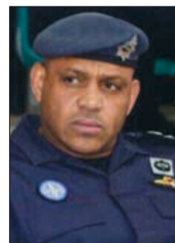
اللواء ركن صالح مطر

كشف مصدر أممي عن فحوى تقرير صادر من إدارة مخفر الجليب إلى المدير العام لمديرية أمن الفروانية اللواء ركن صالح مطر عن أداء متميز لرجال أمن الجليب، حيث تضمن التقرير أن عدد الأوكار المشبوهة التي تم إغلاقها خلال أكتوبر الماضي بلغ