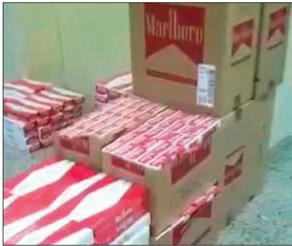
كراتين السجائر التي ضبطت في النويصب