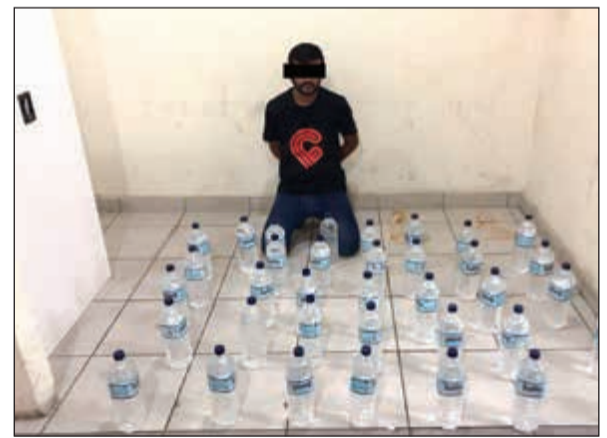
الآسيوي وإمامه الخمر المحلية