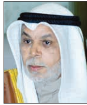
المستشار يوسف المطوعة

أصدرت المحكمة الدستورية، أمس، حكماً برفض الطعن المباشر بعدم دستورية القانون رقم 2 لسنة 2016 بشأن إنشاء الهيئة العامة لمكافحة الفساد والأحكام الخاصة بالكشف عن الذمة المالية، وبذلك يحصن القانون.