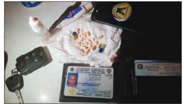
الجيبو المخدرة وأدوات التعاطي

أحيل مواطن في العقد الثالث من عمره إلى مخفر الفروانية للاشتباه في أنه بحالة غير طبيعية على أن يحال لاحقاً إلى التنفيذ المدني لكونه مطلوباً لمبلغ مالي. وجاءت إحالة الشخص إلى المخفر إثر حادث تصادم وجهاً لوجه مع باص في الفروانية. وقال مصدر أممي إن رجال الأمن لدى وصولهم إلى موقع البلاغ تبين لهم أن قائد المركبة في حالة غير طبيعية وأن جمعية التضامن تؤكد ذلك، هذا، ومن المقرر أن يحال المتسبب فيه إلى الأدلة الجنائية.