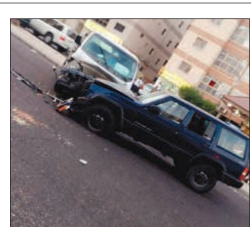
من حادث تصادم الباص بالسيارة

توزع على الطاعنات وغيرهن من المتزوجات وأم من غير كويتي، وأشارت