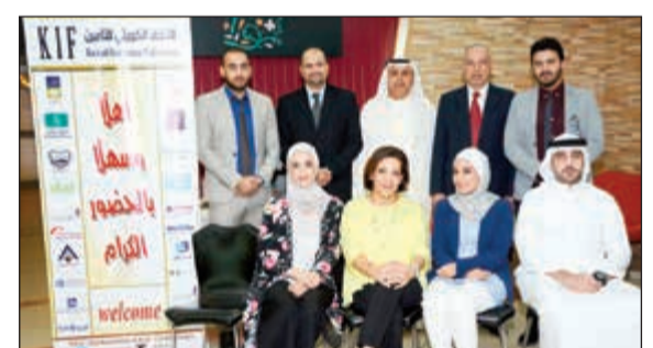
لقطة جماعية للمشاركين مع الأمين العام للاتحاد الكويتي للتأمين عادل المريح

وكذلك شاركت شركة تكافل الراجحي من المملكة العربية السعودية بحضور هذا البرنامج، ويهدف البرنامج لتعريف المشاركين وإكسابهم بالمعارف والمهارات المتعلقة بالمحاسبة عن عمليات التأمين التكافلي طبقاً لطبيعتها المتخصصة فضلاً عن متطلبات معايير المحاسبة الصادرة عن هيئة المحاسبة والمراجعة للمؤسسات المالية الإسلامية فيما يتعلق بأسس الاعتراف والقياس والإفصاح والعرض للاصول والالتزامات والإيرادات والمصرفيات بالقوائم المالية لشركات التأمين التكافلي.