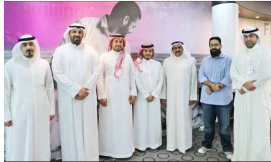
العسوسى متوسطاً فريق عمل الشركتين

الإداري، كما تم بحث كل التحديثات المهمة التي تطرأ على هذا القطاع وكيفية تطبيقها في مختلف الأقسام.