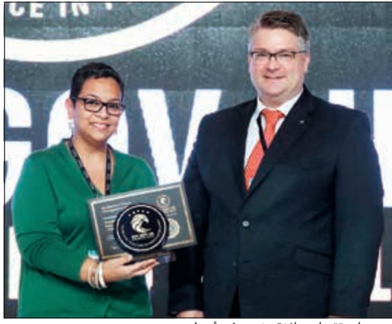
بورسلي تتسلم جائزة «زين» في أبوظبي

وقد أُنبتت المواهب الوطنية الشابة أنها قادرة على العمل والإبداع إذا ما أُتيحت الفرصة المناسبة لها، خصوصاً أن القطاع الخاص يملك العديد من المقومات التي تحفز أصحاب الطاقات والمهارات، ويأتي توظيف الكوادر الكويتية الواعدة في إطار هذا التوجه العام.