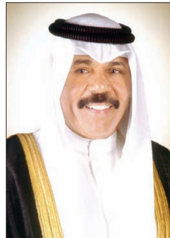
سمو ولي العهد الشيخ نواف الأحمد

مريم بندق - عبد الكريم أحمد | وصفت مصادر حكومية حكم المحكمة الدستورية برفض الطعن المقدم من 6 قضاة في هيئة مكافحة الفساد بالخطوة المستحقة التي تعزز عمل الهيئة، مؤكدة أنه تم تحصين الهيئة، ويخضع القضاء كغيرهم لقانون مكافحة الفساد وتقديم ما يطلب منهم حسب نص القانون والذي على رأسه إقرارات الذمة المالية. ويوجب الحكم الذي أصدرته المحكمة الدستورية أمس برئاسة رئيس المجلس الأعلى للقضاء رئيس محكمة التمييز رئيس المحكمة الدستورية المستشار يوسف المطاوعة، سيطبق قانون الهيئة على كل من رئيس وأعضاء المجلس الأعلى للقضاء، رئيس