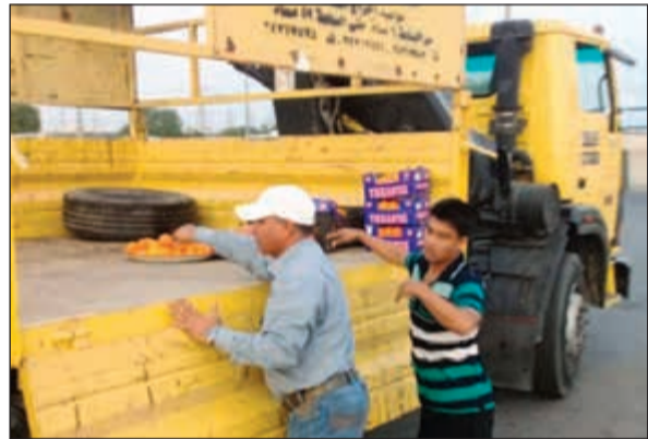
مصادرة مواد غذائية

شن فريق الباعة المتجولين في بلدية الأحمدي حملة تم خلالها مصادرة وإتلاف 81 صندوقاً من الخضراوات والفاكهة غير صالحة للاستهلاك الآدمي، كما قام فريق من ادارة السلامة في بلدية المحافظة بحثريه 6 تنبيهات مخالفة قواعد السلامة ورمي الأنقاض في احد المواقع، إضافة الى قيام فريق الطوارئ بحثريه 12 مخالفة وإزالة 48 اعلاناً مخالفاً ضمن حملة «بتعاونكم نجعلها».