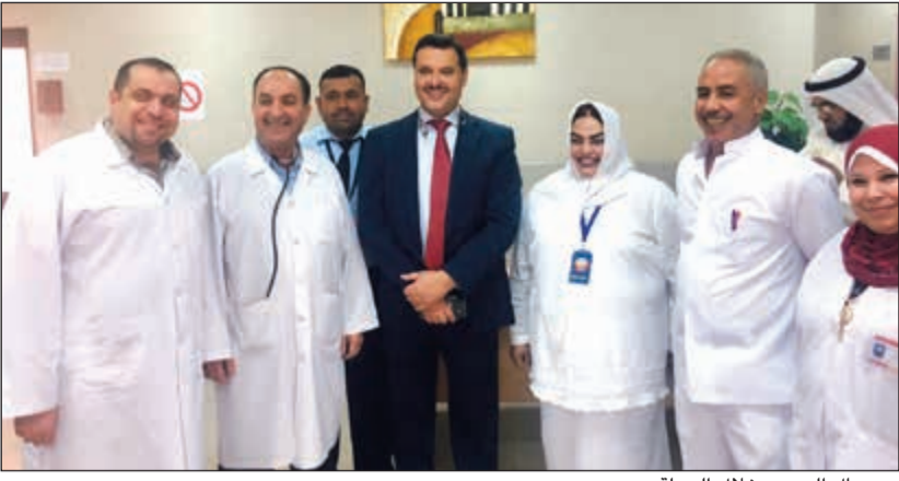
د. جمال الحربي خلال الجولة

حنا عبدالعبيد - عبدالكريم العبدالله قام وزير الصحة د.جمال الحربي بجولة تفقدية في مركز العارضية الشمالي الصحي ومركز العارضية الجنوبي الصحي ومركز القبرون الصحي لتفقد سير العمل والإطمئنان على توافر المستلزمات الطبية اللازمة، حيث أوصى بتوفير الأجهزة الحديثة وإدخالها في المراكز.