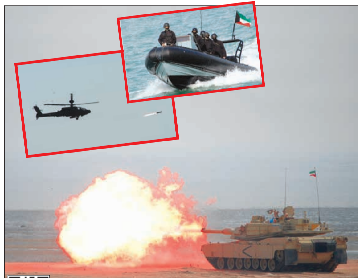
تناغم وتناسق في أداء المهام القتالية بين أفرع الجيش المشاركة في تمرين «أسد 3»