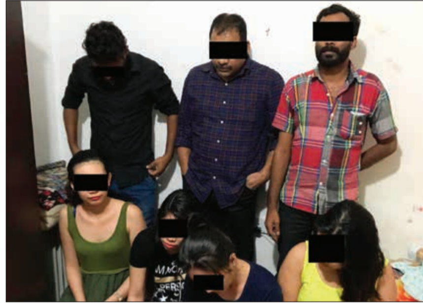
اعضاء التشكيل العصابي عقب ضبطهم

وبحسب مصدر أمني، فإن معلومات وصلت الى رجال أمن مخفر الجليب من مصدر سري عن 3 أسبويين يقومون بالترويج لنسوة ساقطات ومستعدين لتوصيل بائعات الهوى إلى منازل راغبي المتعة الحرام. وقال المصدر: تم ضبط الوافدين واعترفوا بعملهم المشبوه وأرشدوا عن النسوة اللاتي يتعاملون معهن في هذه الخدمة، ليتم اللقاء القبض عليهن وجار ابعادهن جميعاً عن البلاد.