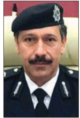
اللواء عابدين العابدين

أمر مدير عام مديرية أمن محافظة الفروانية اللواء ركن صالح مطر بتحويل شاب إلى إدارة الآداب العامة للمباحث الجنائية تمهيداً لإحالاته إلى النيابة العامة للتشبه بالجنس الآخر وأرفق بملف الإحالة باروكة وأدوات مكياج. وبحسب مصدر أمني فإن إحدى دوريات أمن الفروانية اشتبهت في شخص يضع مكياجاً صارخاً فتم توقيفه وبسؤاله عن المكياج الذي يضعه قال انا أميل للجنس الآخر ويا ليت تحولوني إلى حيث أجد نفسي ولا تسجنوني ويتفتش سيارته عثر على المضبوطات الى جانب 3