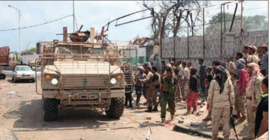
عناصر من القوات اليمنية يعاينون موقع أحد التفجيرات الانتحارية في عدن امس