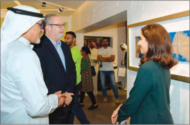
السير الأمريكي لورانس سيلفرمان يطلع على مشاركة الفنانة البحرينية الشبيخة مروة آل خليفة