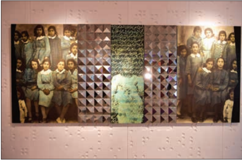
جدارية للفنانة سميرة علي خانزاده