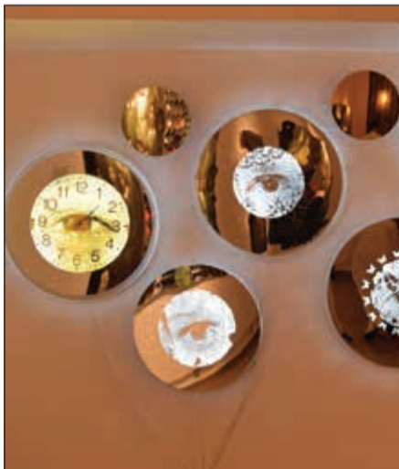
جانب من مشاركات «مرايا»