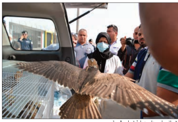
إشراف طبي على عملية تسليم الصقور