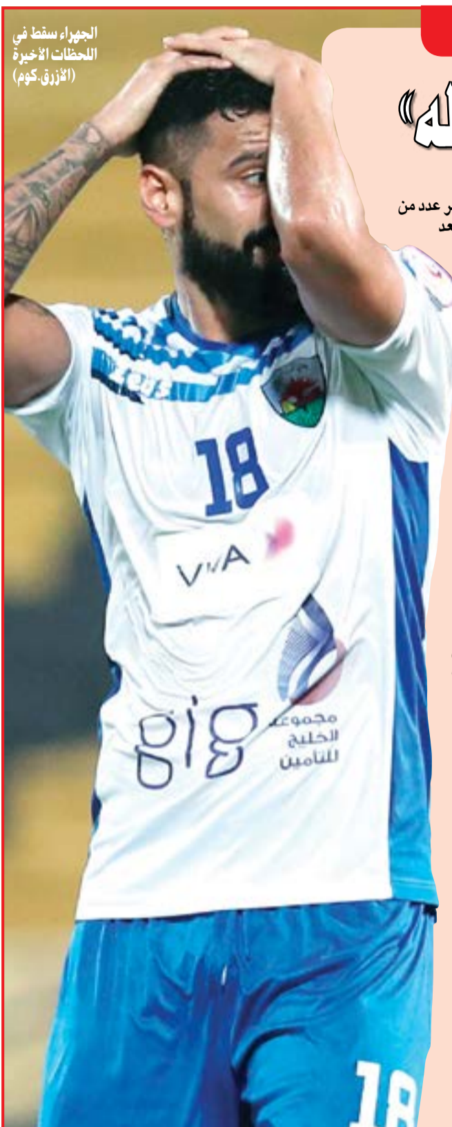
الجهراء سقط في اللحظات الأخيرة (الأزرق، كوم)

حقق القادسية الأهم في هذه الجولة وهو العودة الى طريق الانتصارات وكذلك تسجيل 5 أهداف ما يدل على عودة الهجوم الى وضعه الطبيعي، بالإضافة الى الروح القتالية العالية كما ظهر الفريق بصورة متجانسة