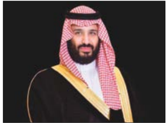
صاحب السمو الملكي الأمير محمد بن سلمان ولي العهد نائب رئيس مجلس الوزراء وزير الدفاع

بحزم على كل من تطاول على المال العام ولم يحافظ عليه أو اختلسه أو أساء استغلال السلطة والتفوق فيما أسند إليه من مهام وأعمال تطبق ذلك على الصغير والكبير لا نحشى في الله لومة لائم، بحزم وعزيمة لا تلين، وبما يبرئ نمتنا أمام الله سبحانه ثم أمام مواطنينا. وبناء على ما تقتضيه المصلحة العامة.