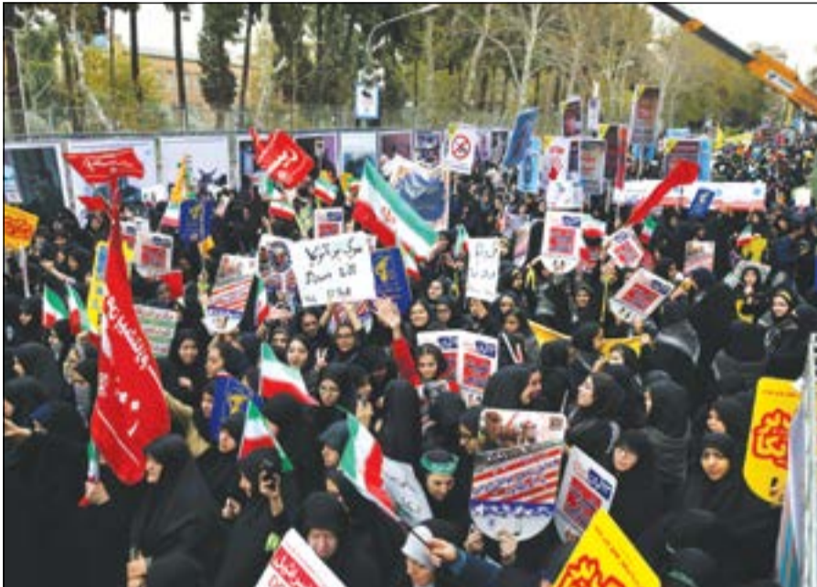
إيرانيون يرفعون لافتات مناهضة للولايات المتحدة خلال مسيرة أمام المقر السابق للسفارة الأميركية في طهران أمس

المرشد الأعلى للثورة الإيرانية علي خامنئي إن الولايات المتحدة هي «العدو رقم واحد» لإيران. وفي سياق متصل، ذكرت وكالة «تسنيم» للأنباء أن صاروخا باليستيا من طراز (قدر) بمدى يصل إلى ألفي كيلومتر عرض قرب سفارة الأميركية السابقة في طهران التي تحولت الآن إلى مركز ثقافي خلال مسيرات امس في إشارة على التحدي.