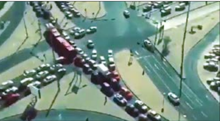
السطحة والسيارة المخالفة تسببتا في عرقلة حركة السير لعدة كيلو مترات

تكرار مثل هذه الأخطاء مستقبلاً. هذا وبدأ الشرطي في المقطع وهو يغلق الطريق بشكل تام لتمكين سطحة من رفع مركبة حدث من تأخير وتعطيل لهم وأنه تم إعطاء تعليمات محددة لرجال الأمن بعدم