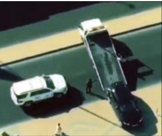
السطحة وقد أغلقت الشارع ويبدو الشرطي يوقف حركة السير