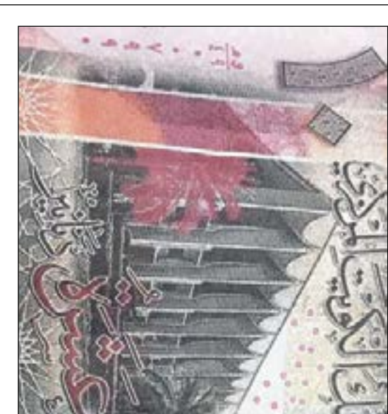
العملة المزورة طبعت بطريقة بدائية

عبدالعزيز الفضلي- محمد الجلاهمة كشفت وزارة التربية عن فتح تحقيق موسع في حادث اعتداء «مؤسف» على عضو هيئة تدريس وطالب بمدرسة ثانوية تابعة لمنطقة الأحمدى التعليمية، مؤكدة اتخاذ كل الإجراءات القانونية بحق مرتكبيه. وكان معلم في ثانوية بمنطقة علي صباح السالم (أم الهيمان) وطالب قد تعرضا إلى طعن من قبل