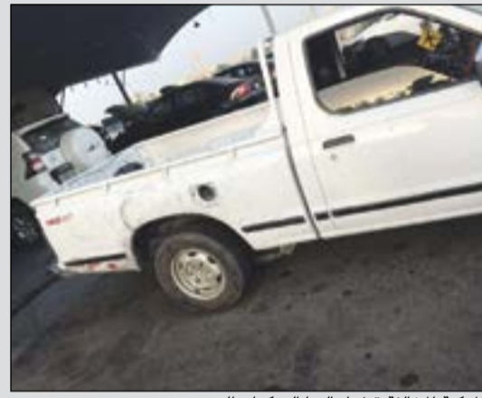
المركبة المخالفة قبل إحالتها إلى كراج الحجز

حرر رجال امن الاحمدي 5 مخالفات جسيمة لشاب كويتي وهي استهتار ورعونة وتعريض حياة الآخرين للخطر وصدور اصوات مزعجة وعدم وجود لوحات امانية وخلفية وعدم حمل دفتر، وتمت حالة المستهتر الى النظارة والمركبة