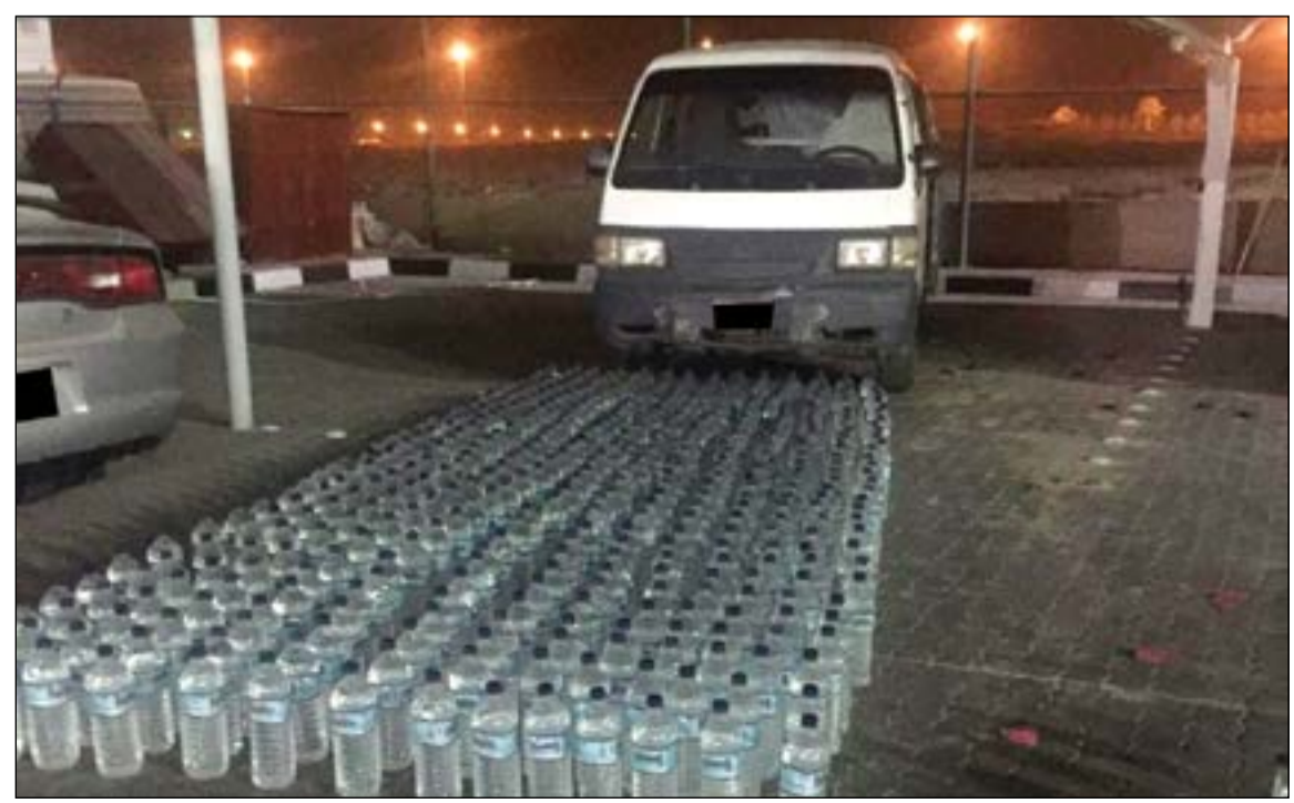
الخمر المضبوطة في طريقها للإتلاف

أوقف رجال نجدة الطرق وأفدا من الجنسية الأسبوعية وبحوزته كمية ضخمة من الخمور المحلية التي وصل عددها الى نحو 650 بطلاً تم التحفظ عليها ورفع تقرير بالواقعة بأمر من اللواء عبدالعزيز الهاجري. وقال مصدر امني ان دوريات النجدة التابعة للطرق السريعة اشتبهوا في قائد مركبة يترك سيارته عند مشاهدته لدورية النجدة والفرار جرياً على الأقدام فأمر المقدم منصور الحشاش رجاله بملاحقة الوافد الذي تبين انه مخالف لقانون الإقامة وأن المركبة تحتوي على 100 بطل خمر، فقام الأسبوعي وقام بإرشاد رجال النجدة عن مستودع الخمر الذي كان يضعه في باص وبدخله 550 بطلاً محلياً في المهبولة.