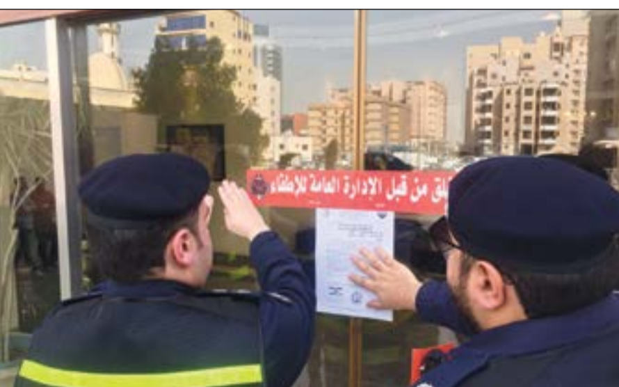
رجال الإطفاء يحررون المخالفة في الفندق