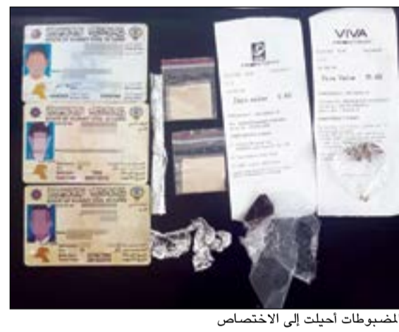
المضبوطات أحيلت إلى الاختصاص