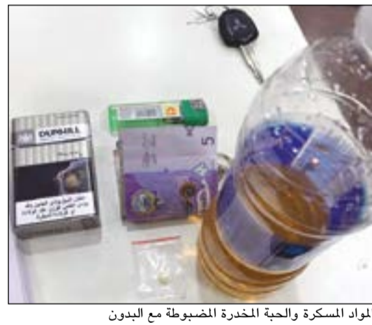
المواد المسكرة والحبة المخدرة المضبوطة مع البدون

جولة لها في منطقة الصليبية اشتبهت في قائد مركبة ولدى الطلب منه التوقف شاهد رجال الأمن قائد المركبة يلقي بورقة كليتيس، وعليه تم تتبعه وتوقيفه، وتبين انه بدون وبحوزته زجاجة مياه صحية استبدل محتوياتها بخمر مستور، وبالعودة الى المندبل الذي ألقاه عثر بداخله على حبة مخدرة.