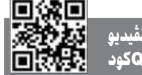
لمشاهدة الفيديو يمكن استخدام QR كود

الوزراء خطط وأهداف وجداول زمنية لتحقيقها، وأن يعملوا مع النواب كأصدقاء وفريق واحد يعمل من أجل الوطن، مبيناً أنه ليس هناك شيء شخصي بل هناك قسم ومبادئ واليات عمل للتعلم بها. من جانب آخر، أعرب الطبطبائي عن أسفه لوجود مافيا تدير مكاتب العمالة المنزلية وأنهم وقفوا ضد شركة الدرة الحكومية، مطالباً الحكومة بالعمل بقوة من أجل إنجاح هذه الشركة. وذكر انه اجتمع الاسبوع الماضي مع وزير التجارة لبحث هذا الموضوع، والوزير بدوره قام بدور كبير واجتمع مع مكاتب العمالة وتوصل إلى تفاهم معهم بهذا الخصوص. وأوضح ان الوزير هو من يملك الآن مساعدة الشعب الكويتي بخفض الاسعار