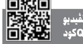
لمشاهدة الفيديو يمكن استخدام QR كود

ورأى ان بعض النواب تحصل لديهم ريكة اذا سيطر عليهم الاعلام ولكن بالنسبة لي لا يهمني اذا كان الاعلام والنواب معي او ضدي، ولذلك عندما افتتح ملف التعيينات والمكاتب الصحية