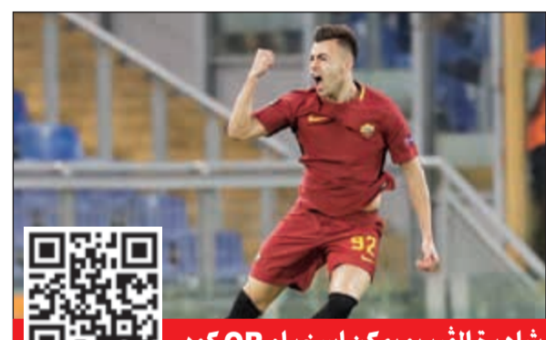
لمشاهدة الفيديو يمكن استخدام QR كود

كما بات المدافع الدولي الفرنسي ثاني لاعب في تاريخ النادي الباريسي يسجل ثلاثية في البطولة بعد السلطان السويدي إبراهيموفيتش. ووفقا لشبكة «سكاي سبورتنس» والمثير أن فريق اندرلخت كان القاسم المشترك بين إنجاز كورزاوا وإبراهيموفيتش الذي هز شباك الفريق البلجيكي بثلاثية في 23 أكتوبر من عام 2013.