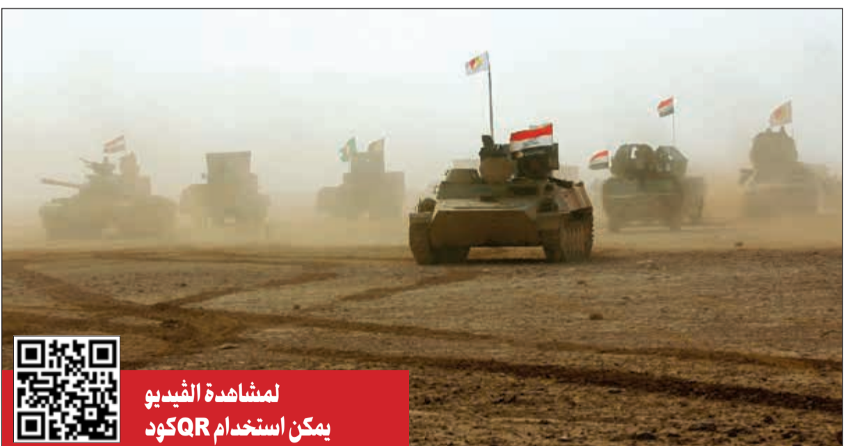
جانب من تقدم القوات العراقية مدعومة بعناصر من «الحشد» باتجاه القائم امس

الطيران العراقي يدمر مواقع لـ «داعش» قرب القائم