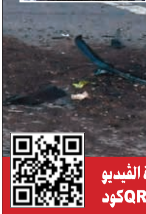
شاحنة المتهم عقب حادث الدهس في مانهاتن امس الاول وفي الاطار صورة وزعتها السلطات الاميركية للأوزبكي المتهم سيف الله سايبوف