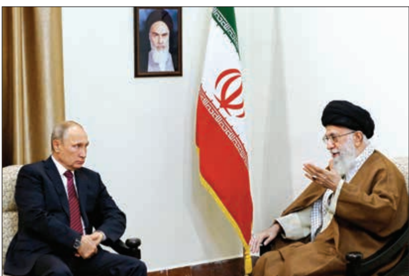
المرشد الأعلى للثورة الإيرانية علي خامنئي مستقبلاً الرئيس الروسي فلاديمير بوتين في طهران امس

للكونغرس الأميركي فرصة 60 يوماً لإعادة فرض العقوبات الاقتصادية على إيران. وقال مسؤول إيراني لـ «رويترز» طلباً عدم ذكر اسمه «هذه الزيارة مهمة جداً. تظهر عزم طهران وموسكو على تعميق تحالفهما الاستراتيجي.. الذي سيرسم صورة مستقبل الشرق الأوسط». وأضاف «تتعرض روسيا وإيران لضغط أميركي.. وليس أمام طهران خيار آخر سوى الاعتماد على موسكو لتخفيف الضغط الأميركي». وذكر مسؤول إيراني آخر أن سياسة ترامب العدوانية تجاه إيران وحدت مواقف القيادة الإيرانية المنقسمة على التحالف مع روسيا.