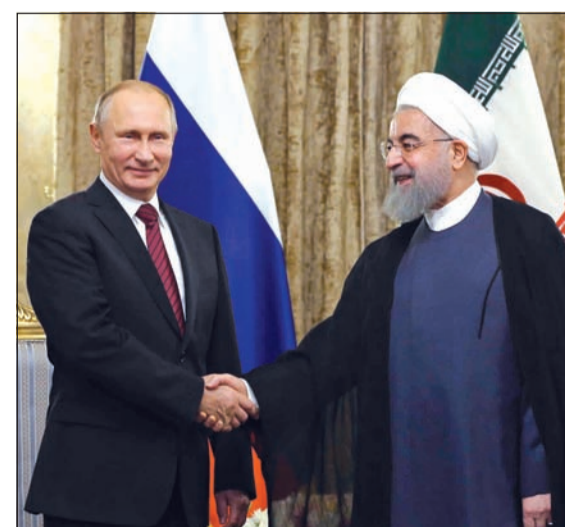
الرئيس الإيراني حسن روحاني مستقبلاً الرئيس الروسي فلاديمير بوتين في طهران أمس

علمت «الأنباء» من مصادر مطلعة ان الهيئة العامة للقوى العاملة زادت إيراداتها بنسبة عالية بعد إجراء تنظيم سوق العمل، مشيرة إلى ان الإيرادات منذ 2017/4/1 حتى 2017/9/31 بلغت حوالي 37 مليون دينار.