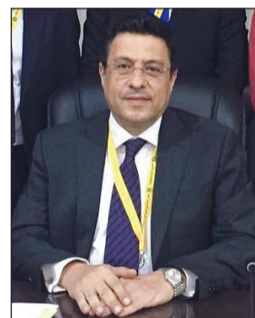
السفير طارق القوني

يصل إلى الكويت اليوم سفير جمهورية مصر العربية الجديد طارق القوني، قادماً من القاهرة لتسلم مهام عمله خلفاً للسفير ياسر عاطف الذي انتهت فترة عمله بالكويت. تجدر الإشارة إلى أن آخر منصب شغله السفير طارق القوني قبل تعيينه سفيراً لجمهورية مصر العربية في الكويت، كان منصب مساعد وزير الخارجية للشؤون العربية، كما شغل منصب مندوب مصر الدائم لدى الجامعة العربية.