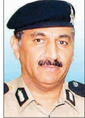
اللواء فهد الشويع

ارتكب الخامسة فلا يسمح له بتجديد إقامته (يوضع بلوك على تجديد الإقامة) ويتم ترحيله عن البلاد. وأشار المصدر إلى أن المقترح تضمن إسقاط المخالفات كل خمس سنوات بمعنى إذا ارتكب الوافد 4 مخالفات خلال 5 سنوات فإنها تسقط بانقضاء تلك الفترة الزمنية. ولفت المصدر إلى أن المخالفات الجسيمة التي تضمنها هذا المقترح في مقدمتها عدم استخدام حزام الأمان واستخدام الهاتف