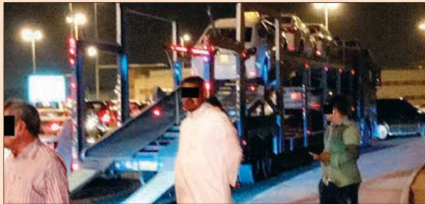
من حملة العارضية الصناعية