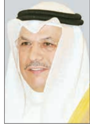
الشيخ خالد الجراح