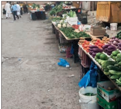
أحد الأسواق العشوائية بالأحمدي

أسفرت حملة مشتركة بين مديرية أمن محافظة الأحمدية والهئية العامة للقوى العاملة «إدارة تفتيش العمل المركزية» على الأسواق العشوائية يوم أمس الأول عن ضبط 36 وافداً منهم 4 بدون إنيات فيما كان بينهم مخالفون لقانون العمل ومنتسول وتمت إحالتهم إلى الإبعاد الإداري. وقال مصدر أممي إن الحملة شملت عدة أسواق في محافظة الأحمدية وكانت مباحثته وهو ما حقق الهدف المرجو منها.