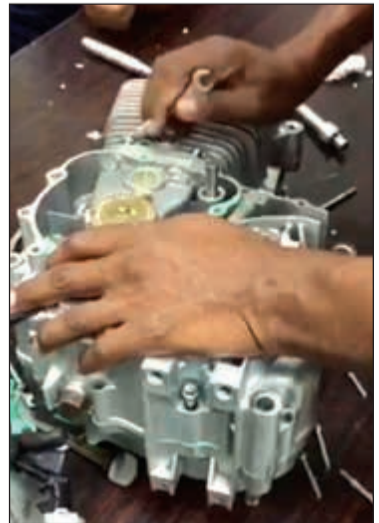
ماكينة «النارية» أحدث طريقة لتهريب الترامادول