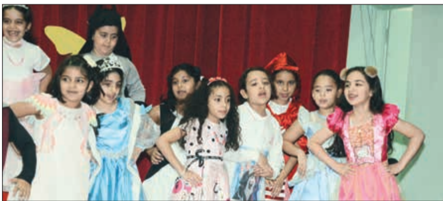
الطلاب ابدعن في الكرنفال