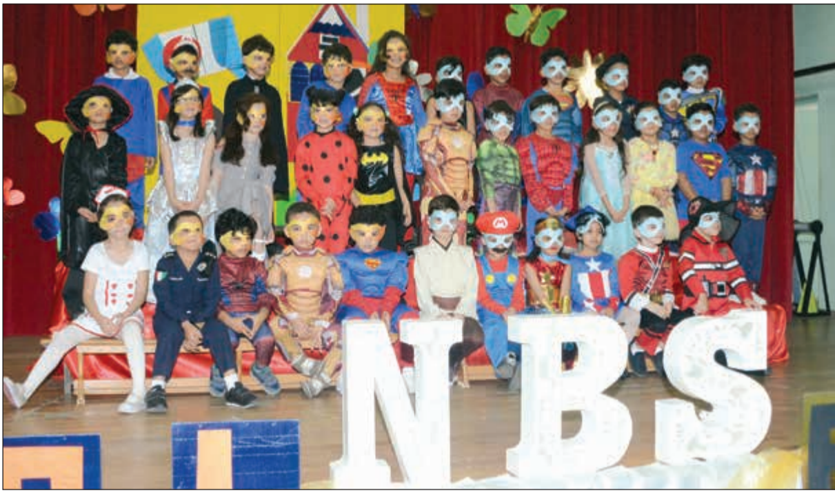
طلبة «نوتنجهام» في لحظة تذكارية بمناسبة كرنفال القراءة