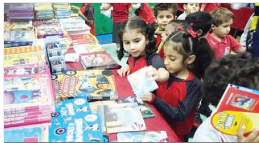
الطلاب يقرآن القصص الجميلة