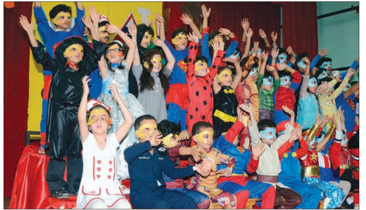
فرحة الأبناء بالكرنفال