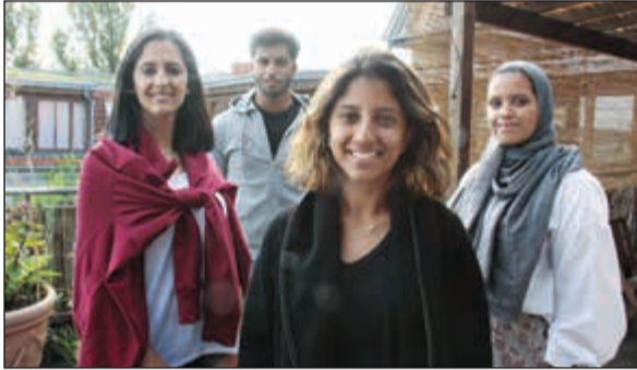
أحد أنشطة البرنامج

فني للفنانين المحليين في جميع أنحاء الكويت لاستهداف القضايا الاجتماعية في المجتمع ونشر رسائل إيجابية، هذه هي طريقة ولادة مشروع حوار على الجدار، فيعد مجرد ستة وتسعين يوما أصبحت الفكرة واقعا من خلال تبادل الجاد والتفاني والعمل الجماعي. حيث تم اختيار جدران في مناطق مختلفة في الكويت مثل كيفان، السائفة والمرقاب وتم التعاون مع فنانين جرافيتي لنقل الرسائل الاجتماعية وترجمتها بشكل فني على الجدران. وتابعت الرشيد: كان مشروع «رقش» للجيل الخامس يهدف إلى التبرع بالكتب لأولئك المحرومين من حق التعليم في جميع أنحاء العالم حيث تم تجميع الكتب بطريقة مبتكرة. وقد وضع الفريق هدفا في بداية المشروع لجمع 5,000 كتاب. تم تجميع اليوم أكثر من 35,000 كتاب من الجدير بالذكر أن كغيراً من الهيئات والمنظمات ساعدت رقص من ضمنها اليونيسكو ووزارة الخارجية الكويتية ممثلة بسفارة الكويت في الأردن. وأخيرا وليس آخرا مشروع الجيل السادس كان نتاج فكرة جماعية أتت من أعضاء الفريق حيث بدأ اهتمام الفريق واضحا جدا بتسمية المواهب. فأنشأ الجيل السادس وسيلة وهي منصة تجمع وتدعم الفنون والمواهب بجمع أنواعها، حيث أن هدف وسيلة هو دعم هذه المواهب وتشجيع العامة على التعبير عنها، وتوعية المجتمع بمدى أهمية هذه المواهب ومدى أهمية الحوافز وتأثيرها على الآخرين. ولتحقيق ذلك، أقيم عمل مسرحي يعد الأول من نوعه بعنوان مقام الحياة والذي جسّد المقامات العربية الموسيقية