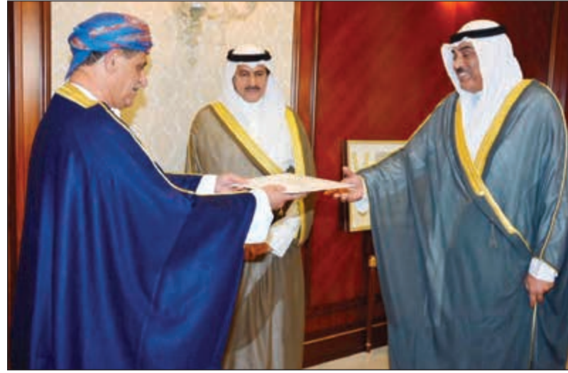
الشيخ صباح الخالد يتسلم نسخة من أوراق اعتماد سفير سلطنة عمان د. عدنان بن أحمد الأنصاري

وعدد من كبار المسؤولين في وزارة الخارجية. كما استقبل النائب الأول لرئيس مجلس الوزراء ووزير الخارجية الشيخ صباح الخالد في مكتبه بالوزارة أمس الثلاثاء نسخة من أوراق اعتماد سفير سلطنة عمان الشقيقة لدى البلاد د.عدنان بن أحمد بن عبدالله الأنصاري. وتمنى الشيخ صباح الخالد خلال اللقاء للسفير الجديد التوفيق في مهام عمله وللعلاقات الأخوية والوثيقة بين البلدين الشقيقين المزيد من النماء والازدهار. وحضر اللقاء نائب وزير الخارجية السفير خالد الجارالله ومساعد وزير الخارجية لشؤون مكتب النائب الأول لرئيس مجلس الوزراء ووزير الخارجية السفير الشيخ د. أحمد ناصر المحمد ومسؤولي وزارة الخارجية.