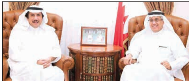
نبيل بن يعقوب الحمير مستشار ملك البحرين لشؤون الاعلام مستقبلاً الشيخ عزام الصباح

استقبل نبيل بن يعقوب الحمير مستشار ملك البحرين لشؤون الإعلام بمكتبه بقصر القضيبة أمس سفيرنا لدى المملكة الشيخ عزام الصباح. واستعرض الحمير مع السفير العلاقات الأخوية التاريخية والروابط الوثيقة التي تربط مملكة البحرين وشقيقتها الكويت وسبل دعم وتعزيز آفاق التعاون الإعلامي الذي يشهد المزيد من التطور والازدهار. وأعرب المستشار الإعلامي عن