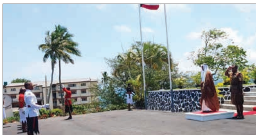
السفير أحمد الوهيب خلال مراسم تقديم أوراق اعتماده سفيراً غير مقيم لدى فيجي

في بيان تلقته «كونا» ان السفير الوهيب نقل لرئيس جمهورية فيجي تحيات صاحب السمو الأمير الشيخ صباح الأحمد راجياً له موقور الصحة والعافية ولحكومة فيجي دوام التقدم والازدهار.