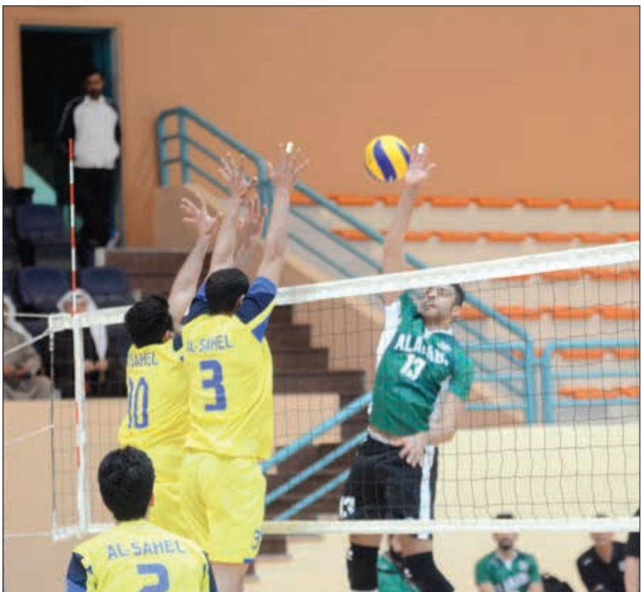
العربي يريد مواصلة انتصاراته