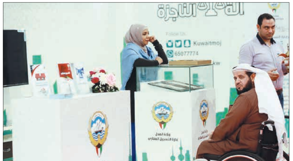
إدارة التسجيل العقاري والتوثيق وحضور دائم خلال معارض إسكان جلوبل