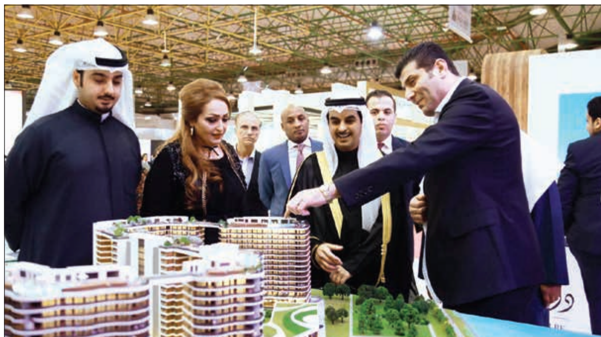
جانب من دورة سابقة