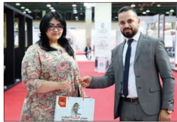
هدايا وجوائز اعادت إسكان جلوبل، على تقديمها لزوار معارضها