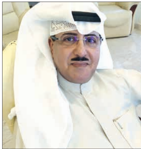
الشيخ فهد المبارك الصباح