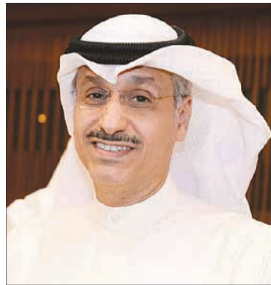
طارق المزرم وكيل وزارة الإعلام

بحضور وكيل وزارة الإعلام طارق المزرم والوكيل المساعد لشؤون الإذاعة الشيخ فهد المبارك عبدالله الأحمد، تقيم إذاعة الكويت ظهر اليوم حفل تكريم للجهات المشاركة والمساهمة في إنجاح برنامج «أحلى صباح» الإذاعي وذلك في قاعة التلفزيون الدور الأرضي.