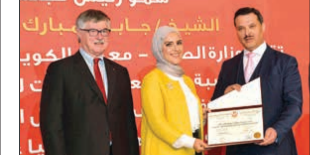
تكريم إحدى الطبيبات الحاصلات على البورد

«إذا أنت باق» على هامش الحفل باذر أحد الإعلاميين الوزير الحربي بالسؤال عن استمراره في منصبه الوزارة، فرد الوزير ضاحكاً: «إذ أنت باق».