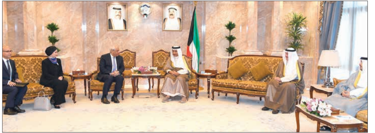
سمو الشيخ جابر المبارك خلال لقائه السفير المصري ياسر عاطف

وتقدم الخرافي بالشكر لجميع الجهات الداعمة والراعية لأنشطة وبرامج «النادي العلمي» والتي تأتي في مجملها لمصلحة أبناء الكويت وتطوير قدراتهم. من جانبه، عبر رئيس قطاع التنمية والبرامج التنافسية في «النادي العلمي»