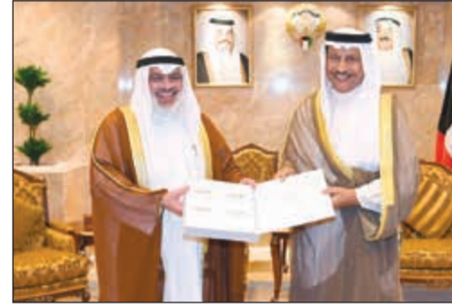
سمو الشيخ جابر المبارك يتسلم تقرير ديوان المحاسبة من عادل الصراوي