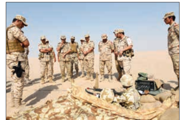
جانب من التمرين

الضباط لتطبيقه على أرض الميدان والتي تؤهل الطالب الضابط وتطور قدراته بما يتناسب مع طبيعة عمله بعد تخرجه لتسلم زمام القيادة. ويجسد التمرين مبدأ التعاون والتنسيق والتخطيط المشترك بين دول مجلس التعاون لدول الخليج العربية وإبراز ثمرة عمل المهام التي تقوم بها الكليات العسكرية لتبادل الخبرات فيما بينها. حضر التمرين الضباط الذين يتم اختيارهم من مختلف صنوف ووحدات القوات المسلحة لشغل الوظائف القيادية ووظائف الأركان وذلك وفق منظومة تعليمية متطورة تلائم المتغيرات الدولية والإقليمية مستخدمة أحدث الوسائل التقنية المعاصرة وأحدث النظريات والعقائد العسكرية.