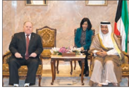
سمو الشيخ جابر المبارك يتسلم تقرير ديوان المحاسبة من عادل الصراوي

كما استقبل سموه كلا من سفير جمهورية كوبا الصديقة لدى الكويت أندريس جونزالوز جاويدو وسفير جمهورية مصر العربية الشقيقة لدى الكويت ياسر عاطف وذلك بمناسبة انتهاء مهام عملهما.