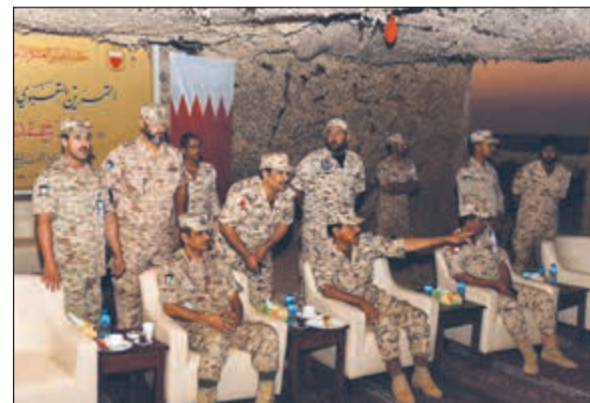
متابعة من الضباط