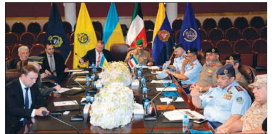
جانب من استقبال رئيس الأركان العامة للنائب الأول لأمين مجلس الأمن الوطني والدفاع الأوكراني