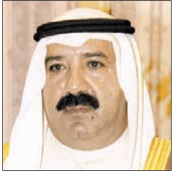
الشيخ ناصر صباح الأحمد

استقبل وزير شؤون الديوان الأميري الشيخ ناصر صباح الأحمد مدير جامعة الكويت د.حسين الأنصاري، وتم خلال اللقاء مناقشة الأمور والمواضيع المهمة.