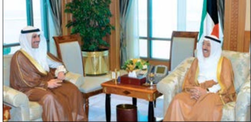
صاحب السمو الأمير الشيخ صباح الأحمد مستقبلاً رئيس مجلس الأمة مرزوق الغانم