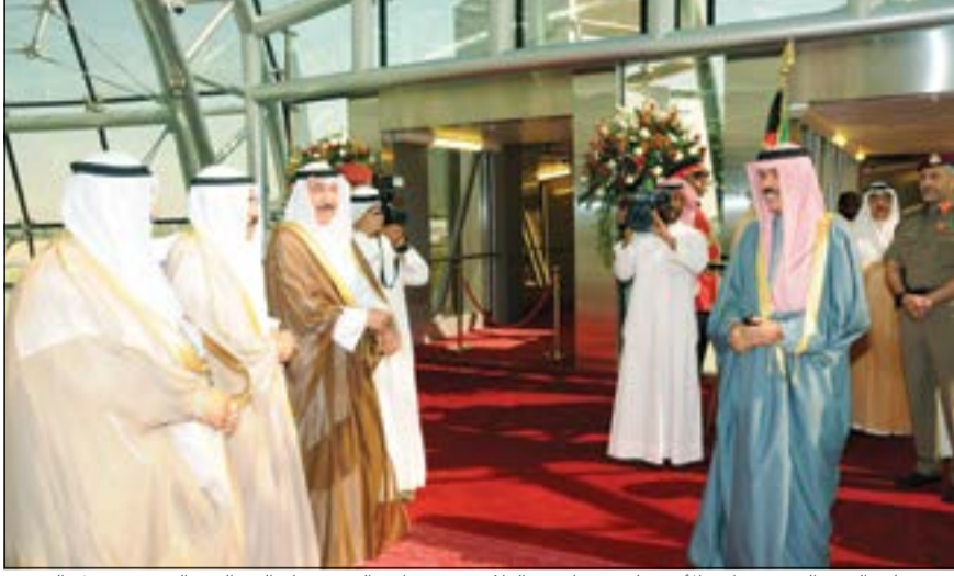
سمو ولي العهد الشيخ نواف الأحمد لدى مغادرته البلاد وفي وداعه الشيخ جابر العبدالله والشيخ فيصل السعود وسمو الشيخ ناصر المحمد