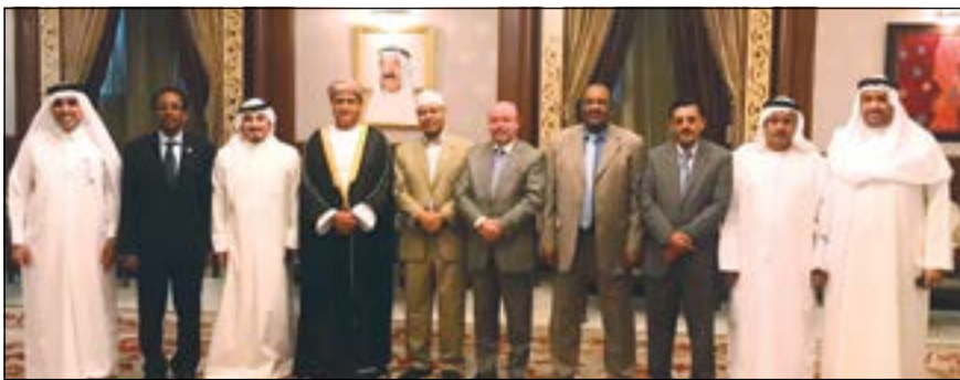
السفير العماني الجديد لدى وصوله إلى الكويت

الكويت الذي بدوره شكرهم على استقباله، مؤكداً الحرص على التواصل معهم.