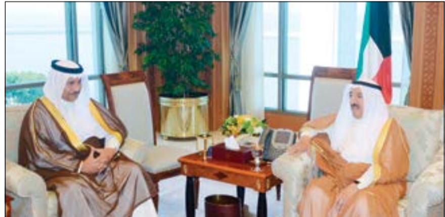
صاحب السمو الأمير الشيخ صباح الأحمد مستقبلاً سمو الشيخ جابر المبارك

استقبل صاحب السمو الأمير الشيخ صباح الأحمد بخصر السيف صباح أمس رئيس مجلس الأمة مرزوق الغانم.