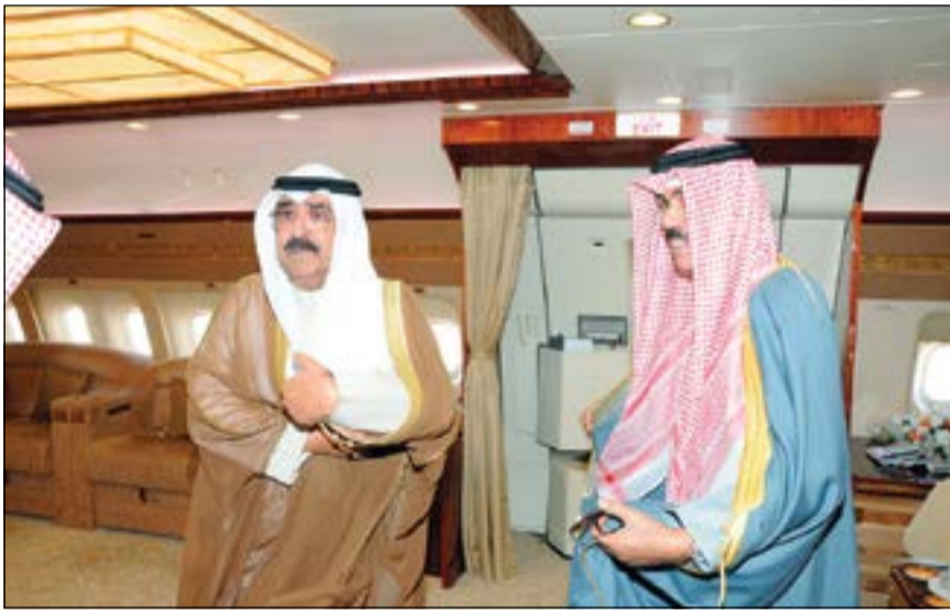
سمو ولي العهد الشيخ نواف الأحمد والشيخ مشعل الأحمد

ب حفظ الله ورعايته، غادر سمو ولي العهد الشيخ نواف الأحمد أمس أرض الوطن متوجهاً إلى الولايات المتحدة الأمريكية في زيارة خاصة بتخللها إجراء بعض الفحوصات الطبية المعتادة. وكان في مقدمة مودعي سموه على أرض المطار رئيس مجلس الأمة مرزوق الغانم والشيخ جابر العبدالله والشيخ فيصل السعود ونائب رئيس الحرس الوطني الشيخ مشعل الأحمد وسمو الشيخ ناصر المحمد وسمو رئيس مجلس الوزراء الشيخ جابر المبارك والنائب الأول لرئيس مجلس الوزراء وزير الخارجية الشيخ صباح الخالد ونائب رئيس مجلس الوزراء وزير الدفاع الشيخ محمد الخالد ورئيس الهيئة العامة للطيران المدني الشيخ سلمان الحمود والمستشار بديوان سمو رئيس مجلس الوزراء الشيخ د.سالم الجابر الأحمد والشيخ د.إبراهيم الدعيج والشيخ علي الجابر والمستشار بديوان سمو ولي العهد د.حمود العتيبي ورئيس المراسم والتشريفات بديوان سمو ولي العهد الشيخ صباح السالم ووكيل ديوان سمو ولي العهد للشؤون المحلية الشيخ أحمد الجابر العبدالله وكبار المسؤولين بديوان سمو ولي العهد. رافقت سموه السلامة في الحل والترحال.