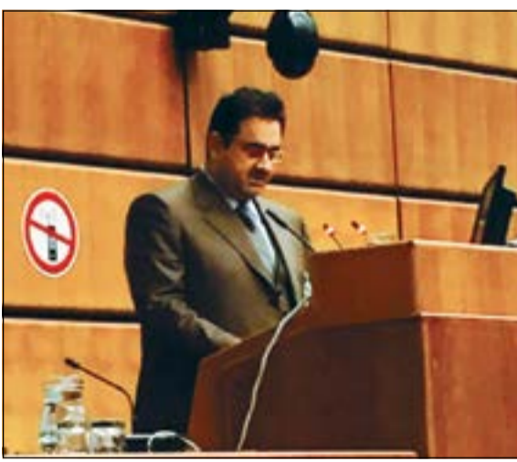
السفير صادق معرفي يلقي كلمة الكويت

العقد الأخير شهد العديد من التطورات في تقنية إنتاج الطاقة النووية ما جعلها أكثر أماناً واستدامة، الأمر الذي دفع بالعديد من الدول إلى التفكير في إنتاج الطاقة النووية. وأشار معرفي إلى مساهمة الكويت في جهود افتتاح بنك اليورانيوم منخفض التخصيب في كازاخستان أخيراً، معتبراً أن هذه المبادرة «خير برهان على إيمان الكويت بحق الدول في تطوير الطاقة النووية وأهمية تمكينها من الموارد التي تحقق ذلك». وعن الموضوعات التي سبتطرق لها المؤتمر، قال معرفي إن المؤتمر سيناقش عدداً من القضايا والموضوعات المهمة من بينها التحديات التي تواجه مجال الطاقة النووية كالتنميط وبناء القدرات وإيجاد بيئة آمنة.