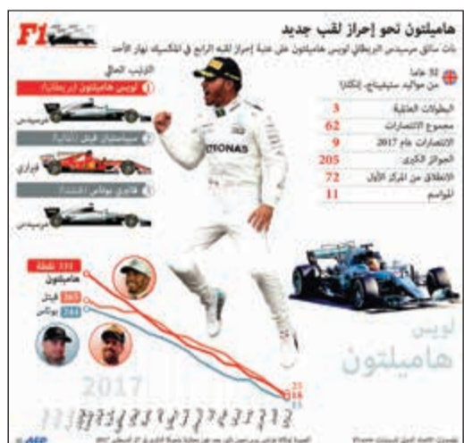
سائق مرسيدس البريطاني: «أريد اللقب»

أكد سائق مرسيدس البريطاني لويس هاميلتون أنه لا يفكر بالاعتزال حالياً، مع اقترابه من إحراز لقبه الرابع في بطولة العالم لسباقات الفورمولا واحد، والمرجع خلال جائزة المكسيك الكبرى اليوم المرحلة الثامنة عشرة من بطولة العالم. ويحتاج هاميلتون إلى الحلول ضمن الخمسة الأوائل في المكسيك، لحسم اللقب، بصرف النظر عن نتيجة منافسه الأقرب الألماني سباستيان فيتل، سائق فيراري وبطل العالم أربع مرات بين 2010 و2013، علماً أنه يتبقى ثلاث سباقات حتى نهاية الموسم، هم - إلى المكسيك - جائزة البرازيل الكبرى وجائزة أبوظبي الكبرى. ومع اقترابه من لقبه الرابع والثاني في المواسم الثلاثة الأخيرة، شدد هاميلتون (32 عاماً) على أن الاعتزال ليس على جدول أعماله حالياً. وقال هاميلتون «يمكنني بسهولة أن أتخيل نفسي من دون الفورمولا واحد، إلا أن الأمر ليس مطروحاً حالياً».