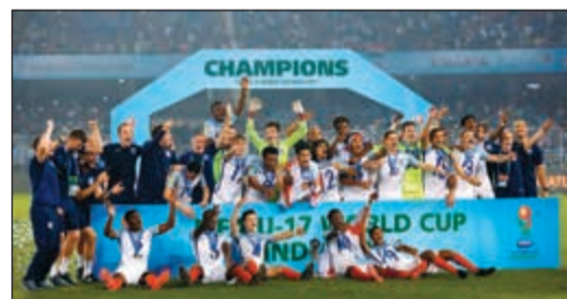
فرقة لاعبي منتخب إنجلترا باللقب

أحرزت إنجلترا لقبها الأول في كأس العالم تحت 17 عاماً في كرة القدم، بعدما قلبت تأخرها بهدفين أمام إسبانيا التي فوز عريض 2-5، أمس في النهائي في مدينة كالكونتا الهندي. ودخلت إنجلترا نادي الأبطال، الذي تتصدره نيجيريا (5) والبرازيل (3) خالفة النسخة الحالية بفوزها أيضاً على مالي 2-0. من جهتها، حرمت إسبانيا من التتويج للمرة الرابعة بعد حلولها وصيفة في 1991 و2003 و2007، أمام 66 ألف متفرج.