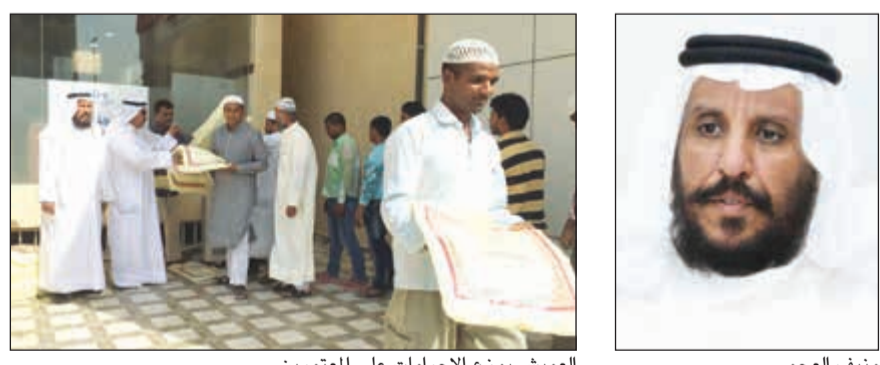
العميش يوزع الإحرامات على المعتمرين

عهد بالدين الحنيف، وبحاجة لإخوة بعضهم بهم في حياتهم الإسلامية الجديدة، علاوة على اندماجهم مع مسلمي الجاليات الذين يرافقونهم في هذه العمرة للاستفادة منهم إيمانيا وسلوكيا. لاسيما أننا نرسل دعاء بكل اللغات للمعتمرين للنصح والإرشاد بلغاتهم، وتابع العمي: تم الاعداد المميز لهذه القافلة المباركة حيث حرصنا كعادتنا في رحلات العمرة التي نسيرها بأن نقوم بوضع برنامج شامل للرحلة يشملها منذ الانطلاق وحتى العودة، ونحرص من خلاله أن نهيبه على الأجواء المناسبة للمعتمرين للتألق بنعيم الطاعة في هذه البقاع الطاهرة فتستهل الرحلة بنداء السفر ثم يقوم الدعاة المرافقون للمعتمرين بشرح آداب السفر