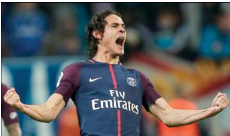
اليوم يومك يا كاثافي

يغيب عنها نيمار منذ انضمامه الى الفريق المملوك قطريا في أغسطس، بعد الأخيرة أمام مونبلييه (0-0).