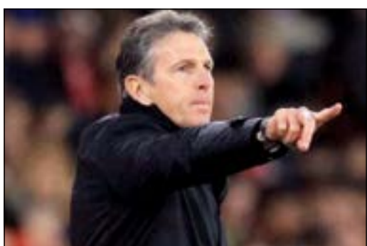
هل يعيد الاستقرار؟

أعلن نادي ليستر سيتي الإنجليزي تعيين الفرنسي كلود بويل مديراً فنياً جديداً للفريق ليحل محل كريغ شكسبير. وكشفت صحيفة ميرور البريطانية أن فريق الثعالب حصل على توقيع بويل لمدة عامين ونصف العام حتى يونيو لعام 2020. ووفقاً للتقارير، فإن أكبر نتيجة حققها كلود بويل كمدرّب في البريميرليغ مع ساوثامبتون كانت أمام ليستر سيتي وتحديداً في شهر يناير الماضي، حيث انتهت بثلاثية نظيفة. وقال بويل نقلاً عن بيان للنادي: «إنه لشرف عظيم لي أن أصبح مدرباً لليستر، النادي الذي تتماشى قيمه مع قيمي. فرصة مساعدة النادي على البناء على أساس نجاحاته الأخيرة مغيرة حقاً». وكان بويل (56 عاماً) المدرب السابق لموناكو وليون، حراً منذ إقالته من تدريب القديسين في يونيو الماضي.