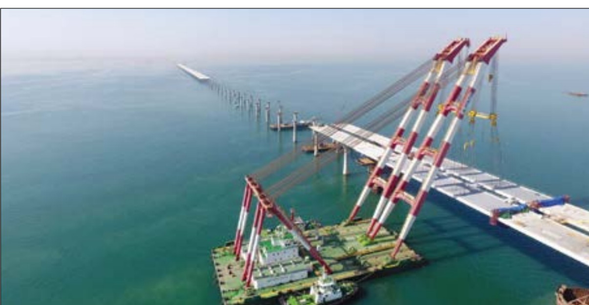
تركيب صفائح جسر جابر