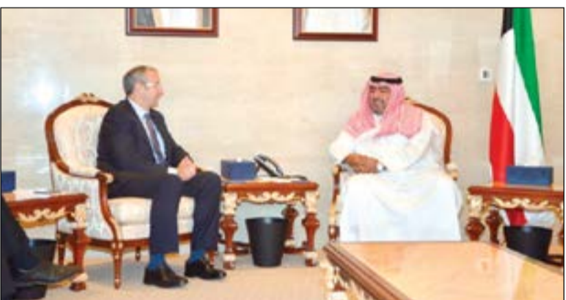
الشيخ ثامر العلي مستقبلا السفير مايكل دافنبورت

استعرض أوجه التعاون والعلاقات الثنائية وسبل تعزيزها وتطويرها إضافة إلى بحث أهم القضايا المشتركة التي تهم البلدين الصديقين على الساحتين الإقليمية والدولية.