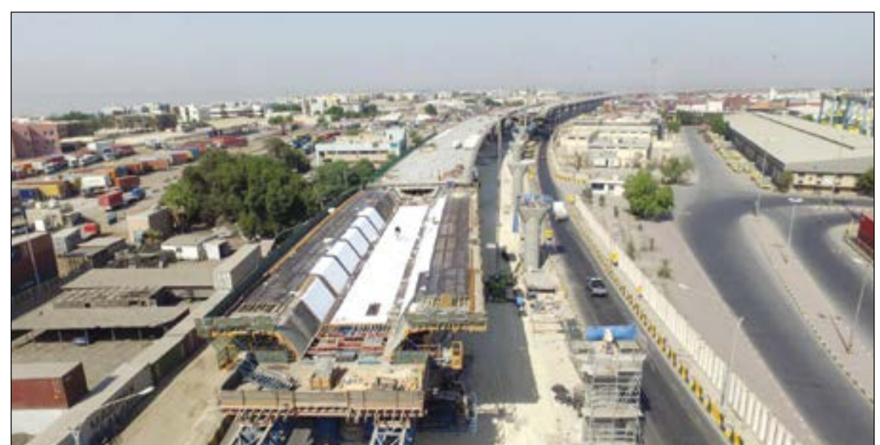
بداية جسر جابر من منطقة الشويخ