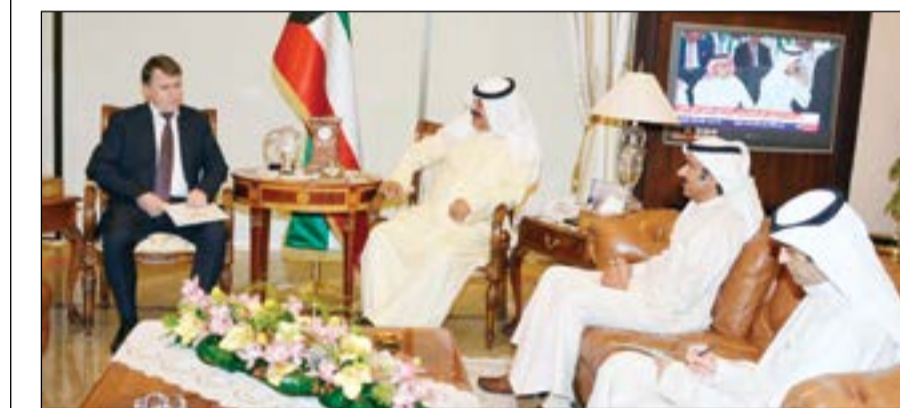
خالد الجارالله خلال اجتماعه مع سفير روسيا ألكسي سولوماتين

التقى نائب وزير الخارجية خالد الجارالله سفير روسيا الاتحادية لدى البلاد ألكسي سولوماتين حيث بحثا عددا من أوجه العلاقات الثنائية بين البلدين إضافة إلى تطورات الأوضاع على الساحتين الإقليمية والدولية. حضر اللقاء مساعد وزير الخارجية لشؤون مكتب نائب الوزير السفير إيهب العمر.