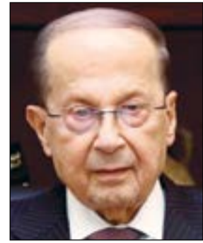
الرئيس ميشال عون