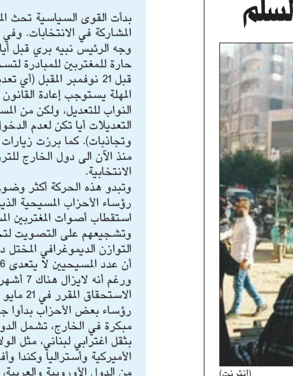
صورة تداولها ناشطون للاحتجاجات في حي السلم

بيروت: اندلعت احتجاجات تخللها قطع طريق وحرق إطارات في ضاحية بيروت على خلفية إزالة بعض المخالفات. وذلك احتجاجا على قيام قوى الأمن الداخلي، بمساندة القوى الأمنية فجر أمس من إزالة عدد من الأكشاك وسيارات الاكبرس المخالفة في موقف حي السلم. وما لبث أن تجمع أصحاب هذه الأكشاك قرب الساحة في اعتصام احتجاجي، حيث أقدموا على إشعال الإطارات وقطع الطريق، معتبرين أن ما قامت به القوى الأمنية قطع لأرزاقهم. وقد استنفر أصحاب الأكشاك وظهر مسلحون في المنطقة، في حين عملت القوى الأمنية مع البلدية على فك الاعتصام وتفريق المحتجين بالطرق السلمية.