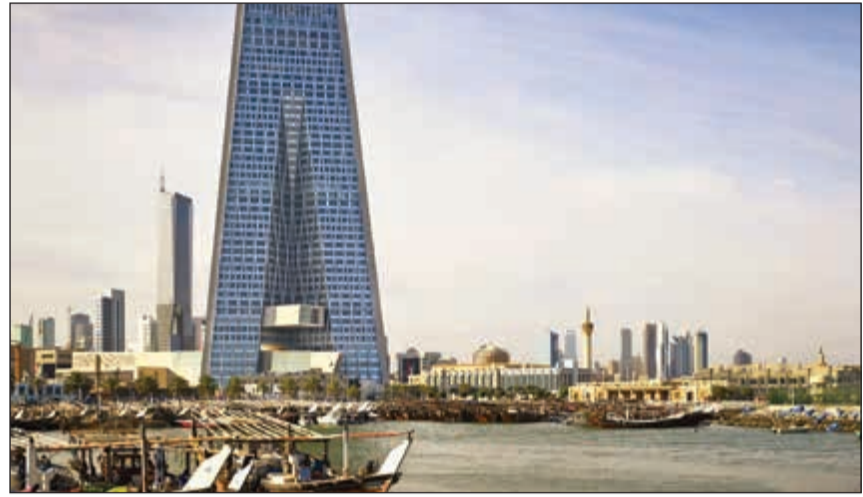
مبنى البنك المركزي

وسجل الائتمان أقل نمو سنوي في أغسطس الماضي منذ 7 أشهر، حيث سجل ارتفاعاً في أغسطس بنحو 3,23٪ بزيادة 1,1 مليار دينار، مقارنة بحجم الائتمان المسجل في أغسطس 2016 والبالغ 34,4 مليار دينار.