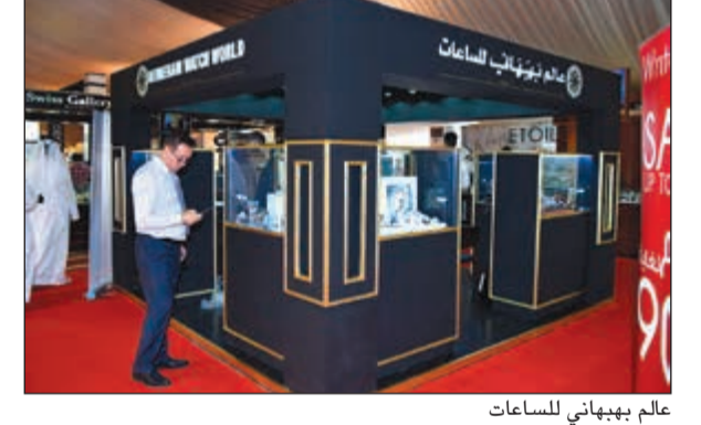
عالم بيهبابي للساعات