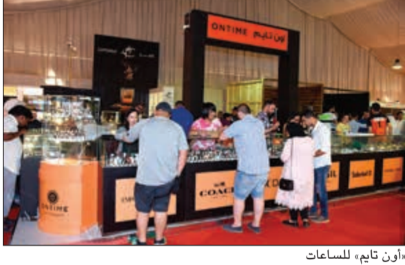
«أون تاي» للساعات