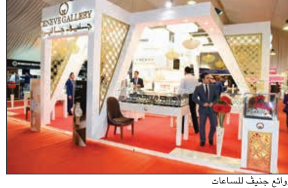
روائع جنيف للساعات