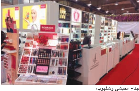
جناح «حبشي وشلهوب»