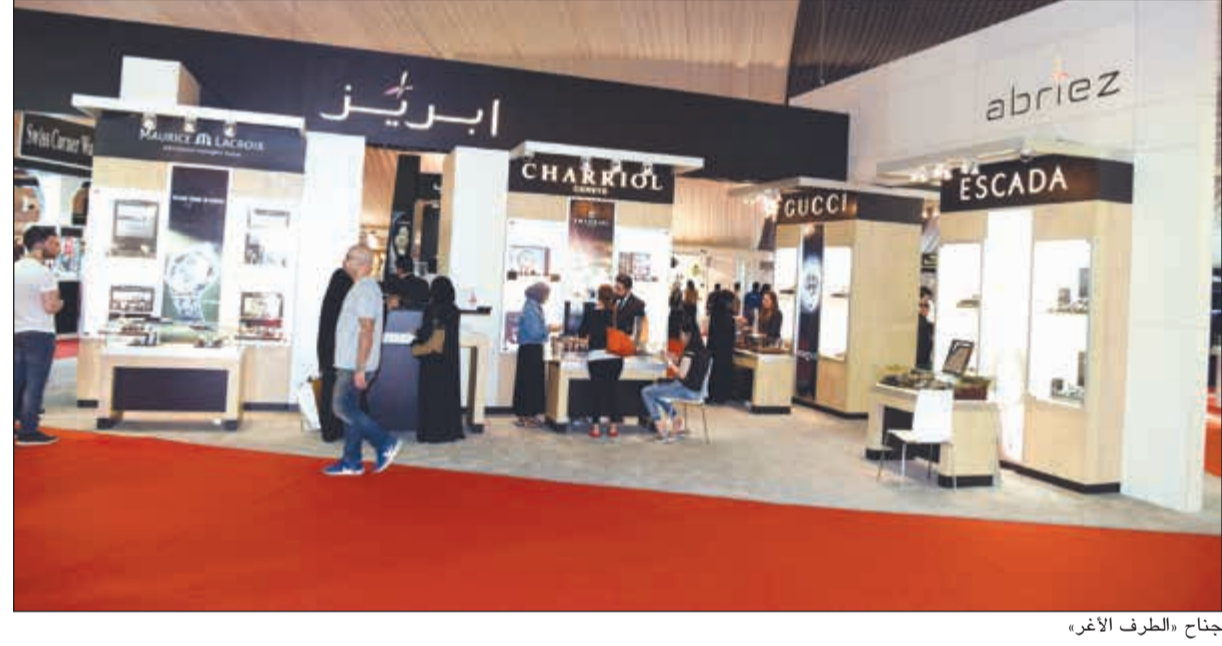
جناح «الطرف الأغر»

شركات عطور عالمية تعزز افتتاح فروع لها في الكويت