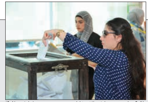
طالبة تدلي بصوتها في الانتخابات (عادل سلامة)

المالك افتتح معرضي 'الخريف للعطور' و'الساعات': 'التجارة' تدعم الشباب الكويتي لمزاولة أعمالهم في العطور والكماليات 12