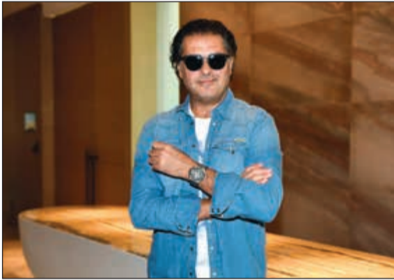
صديق «HUBLOT» الفنان راغب علامة

وقال علامة: ان إعجابه الشديد بهذه العلامة التجارية جعله يقبل فوراً مبدأ أن يكون صديقاً لها، خصوصاً بعد لقائه بتيديسكي والعاملين فيها وليس جديتهم في تحقيق النجاح ومدى احترافيتهم في تقديم كل ما هو جميل، وكيفية تفكيرهم في مجال صناعة الساعات، لافتاً إلى أنه متمسك بهذه الشراكة وكذلك الأمر بالنسبة لهم. وعن كيفية اختياره لما يناسبه من ساعات «HUBLOT»، قال: الساعة تعني لي علامة للأناقة والفخامة والجمال. وعندما أصبح صديقاً لـ HUBLOT بت ارتديتها على أي نوع من الملابس بغض النظر ان كانت تتناسب أم لا. والسبب أنها تتماشى مع كل زي سواء كان لمناسبة رسمية أو حتى الملابس اليومية الرياضية.