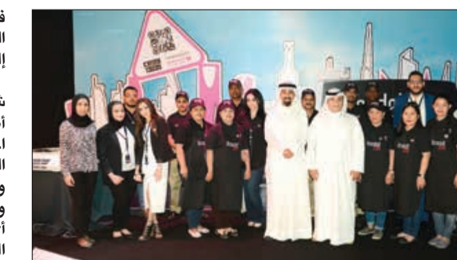
لقطة تذكارية خلال الحفل

في الكويت يعتبر من الأسواق الكبيرة والهامة التي تحتاج إلى هذا النوع من الخدمات. وأضاف أنه ومن خلال شركة «براندات دوت كوم» أصبح العميل قادراً على اختيار أفضل أنواع العطور ومواد التجميل وإرسالها كهدية مع باقة ورد في كافة المناسبات وإلى أي مكان في الكويت ودول الخليج العربي، حيث تقوم الشركة بإيصال هذه المنتجات إلى كافة دول الخليج وعلى حسب طلب ورغبة العميل. وأشار القطامي إلى أن «براندات دوت كوم» ركزت على معالجة مشاكل موجودة في السوق المحلي من أهمها محاربة