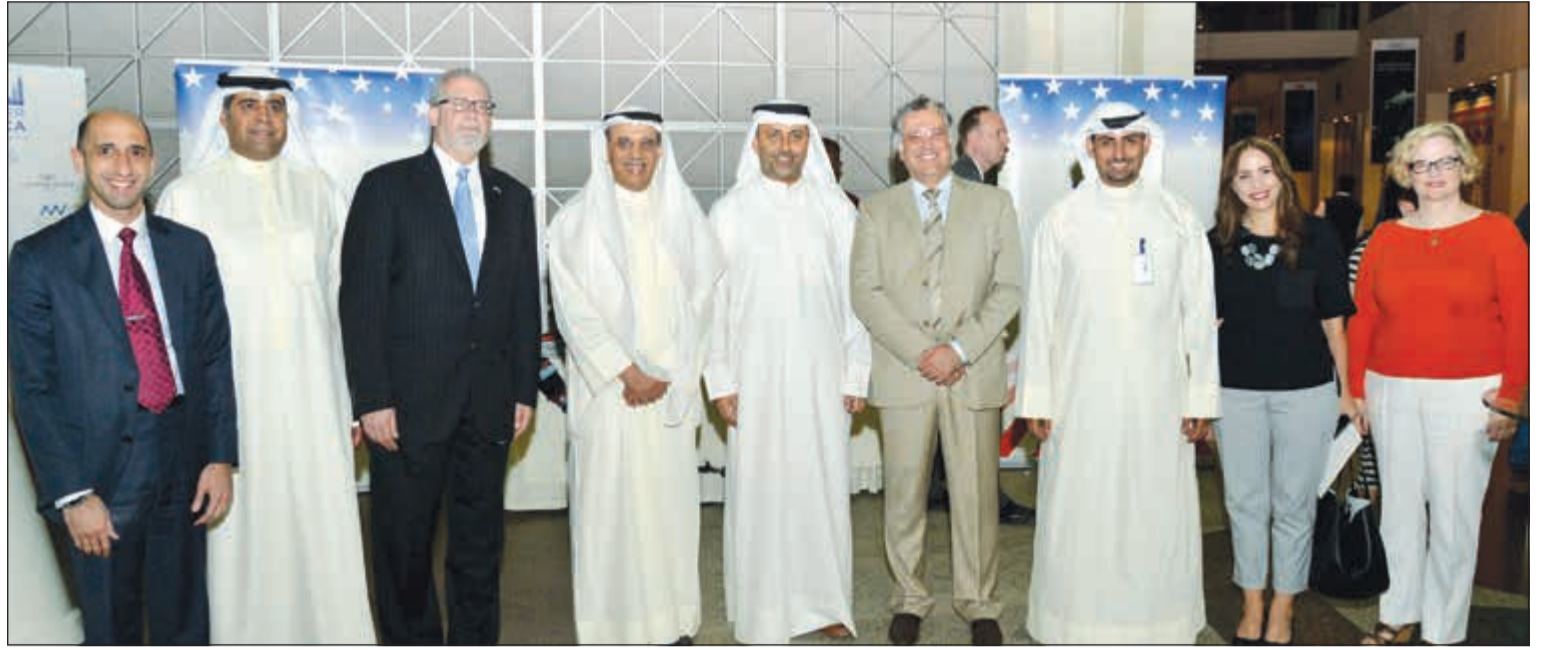
السفير الأميركي لورانس سيلفرمان والملحق الإعلامي هيزر وارد وسامي الرشيد وورش البديري والحضور في الفيلم

«اكتشف أميركا 2017» يواصل برامجه المتألقة بعرض فيلم ثلاثي الأبعاد عن المتنزّهات الأميركية