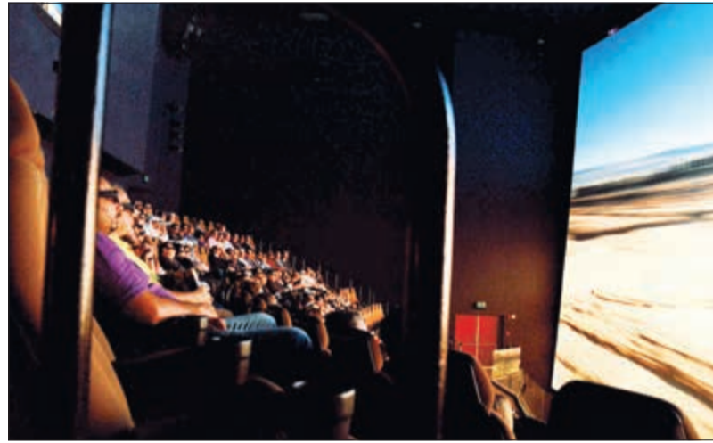
جانب من الفيلم

التعاون الاقتصادي والتجاري بين البلدين يشهد نمواً وهناك المزيد مما يمكننا فعله