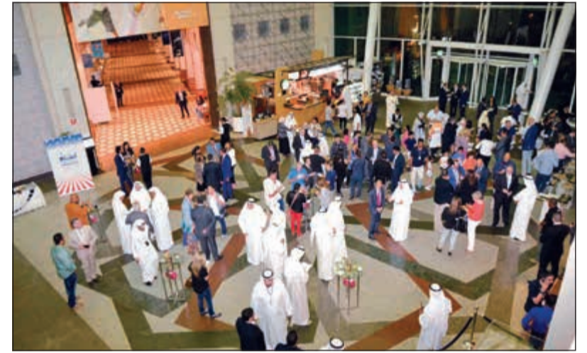
حضور كبير في العرض الأول للفيلم