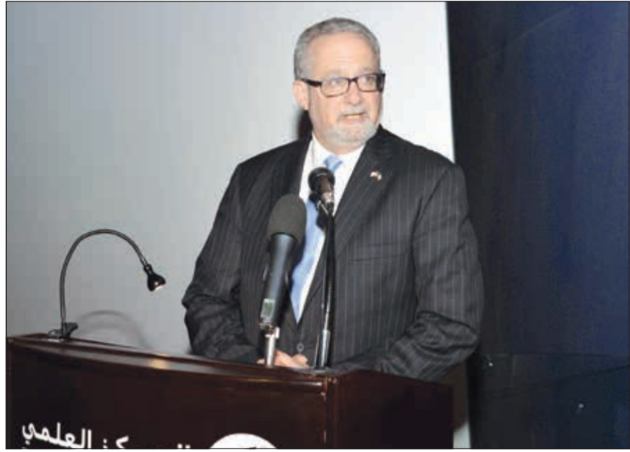
السفير الأميركي لورانس سيلفرمان (شائفاقاس قاسم)