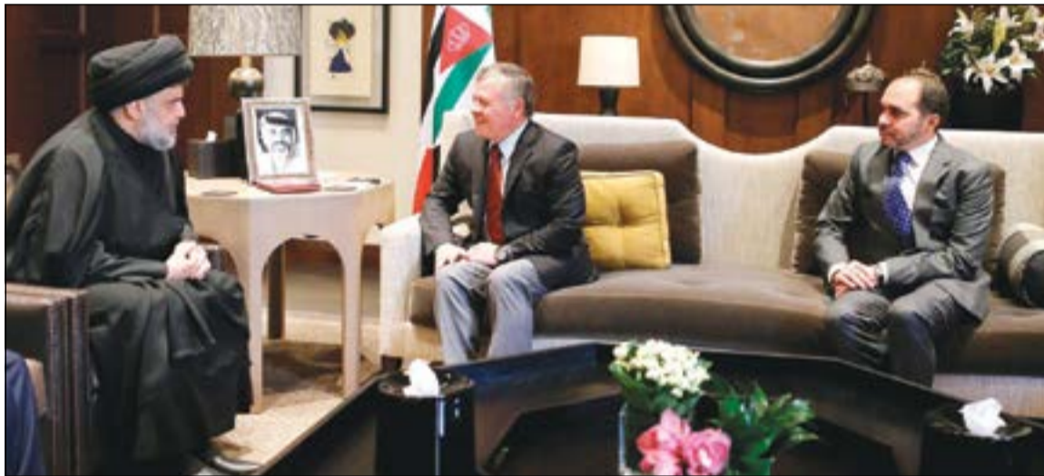
صورة نشرها القصر الملكي الأردني لاستقبال الملك عبدالله الثاني لرئيس التيار الصدري العراقي مقتدى الصدر في عمان امس

عواصم - وكالات: مازال التوتر الحاد قائما بين بغداد وأربيل على خلفية استفتاء الانفصال الذي أجرته كردستان وترفضه بغداد، حيث أصدرت حكومة إقليم مذكرة اعتقال بحق 11 مسؤولا عراقيا بينهم برلمانيون وقادة في فصائل الحشد الشعبي، ردا على مذكرات مماثلة من جهات قضائية في بغداد بحق مسؤولين أكراد.