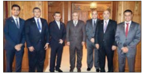
وفد «بيتك» مع وزير التربية ووزير التعليم العالي د.محمد الفارس

جاء ذلك خلال حفل استقبال نظّمته سفارتنا في واشنطن