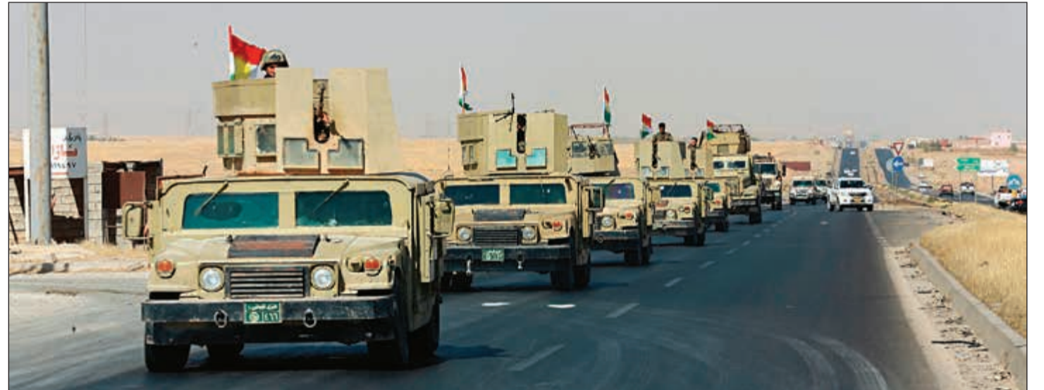
قوات الأمن الكردية خلال توجهها إلى مدينة التون كوبري على مشارف أربيل امس

جزئي الجسر الرئيسي الذي يربط مدينة أربيل بمحافظة كركوك لإعاقه تقدم القوات العراقية. ويهدف تفجير الجسر إلى وقف تقدم القوات ومنعها من الوصول إلى حاجز التفقيش الرئيسي الذي أقامته سلطات أربيل في يونيو 2014 داخل حدود مدينة كركوك الإدارية. لكن مصدرا أميا آخر، أكد استمرار الاشتباكات بين القوات الاتحادية وقوات البيشمركة على أطراف المدينة.